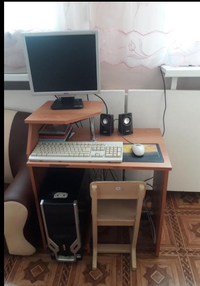
1.7. Рабочий сектор (ИКТ для педагога)