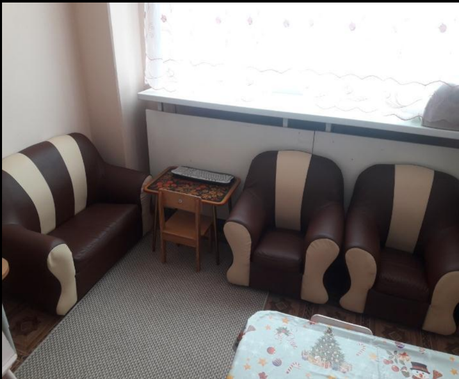
Уголок отдыха (место для отдыха и уединения)