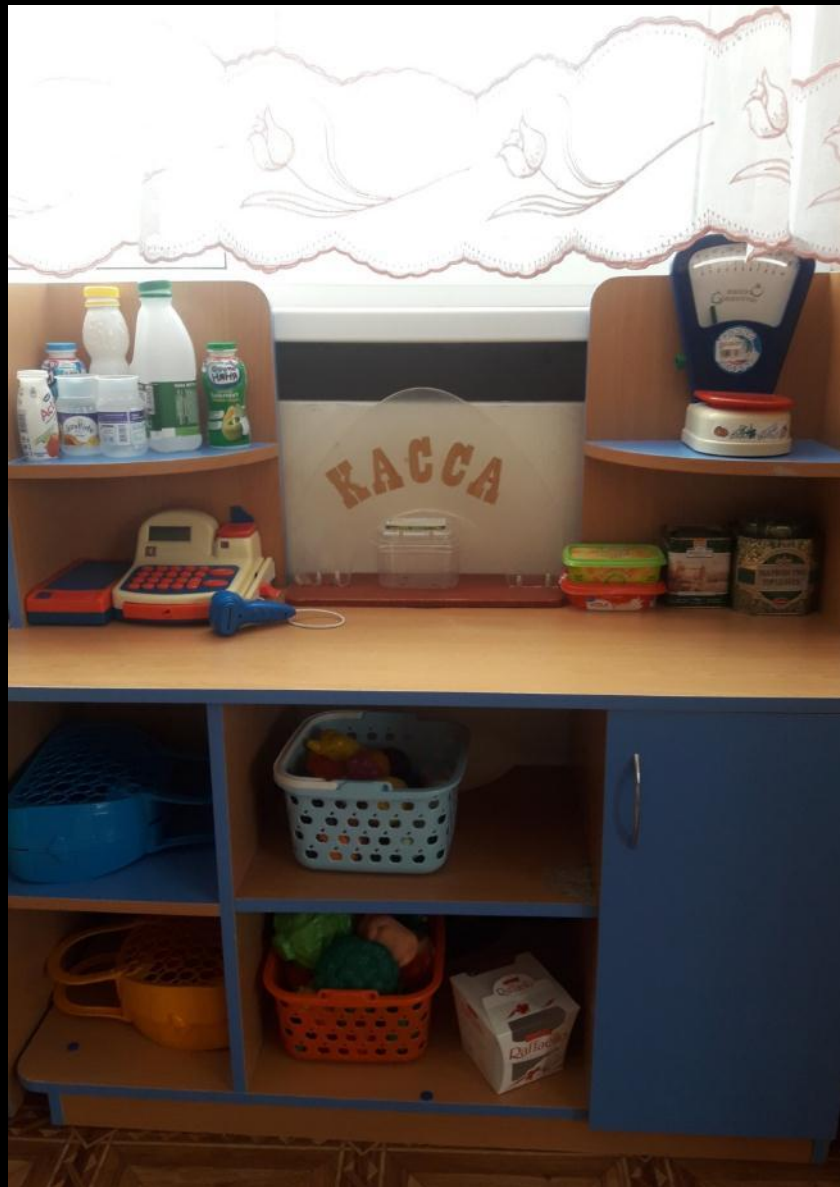
сюжетно-ролевая игра «Магазин»