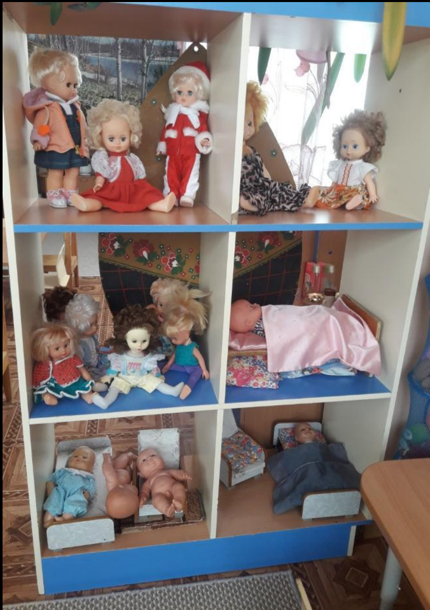
сюжетно-ролевая игра «Семья»