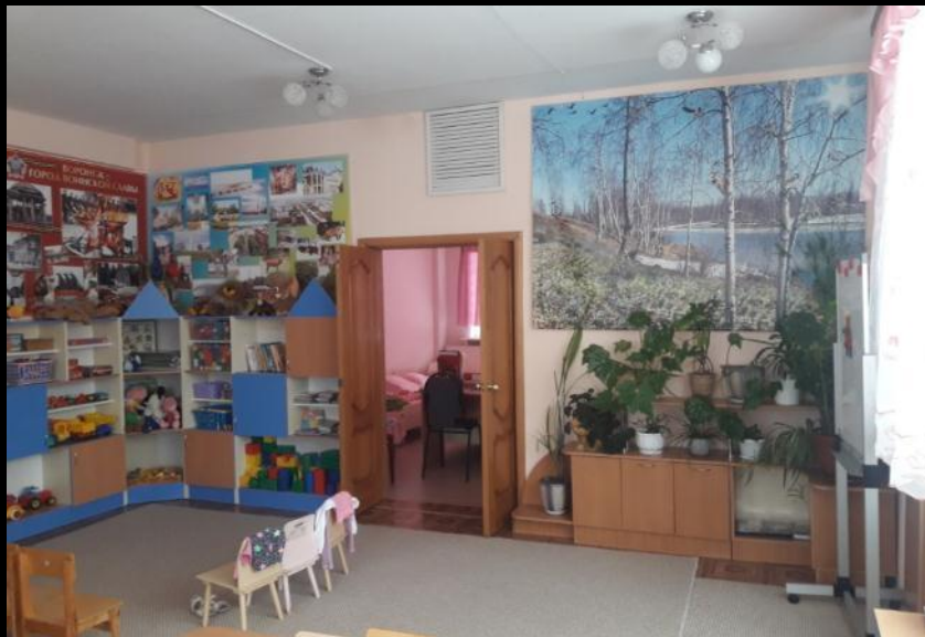
Верхняя левая точка