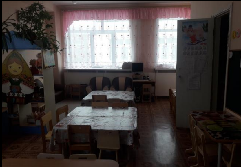
Верхняя правая точка