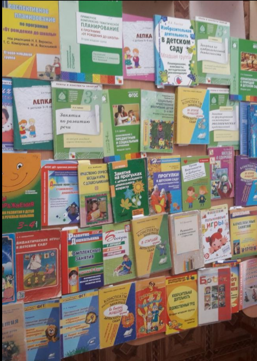
1.6. Рабочий сектор (методическая литература педагога)