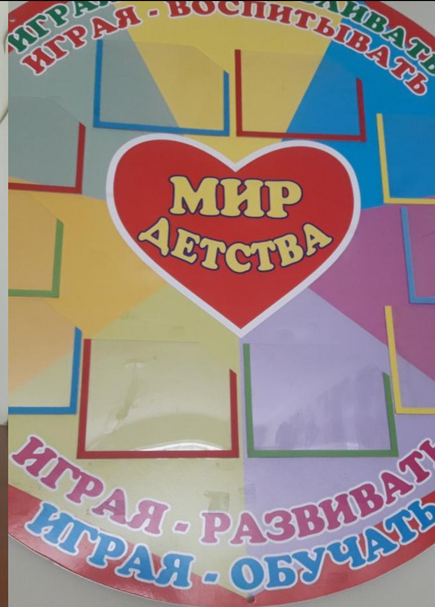
Среда для диалога с родителями (информационный центр)