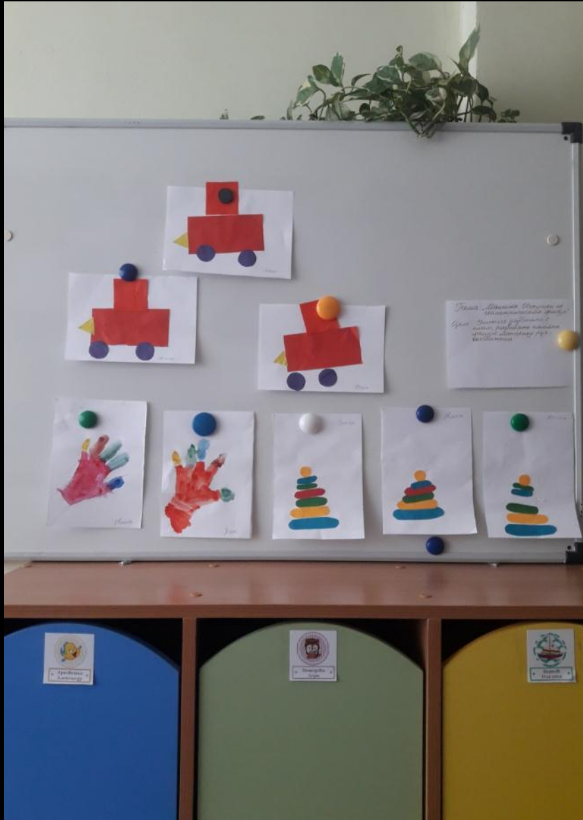
Среда для диалога с родителями (практический центр)