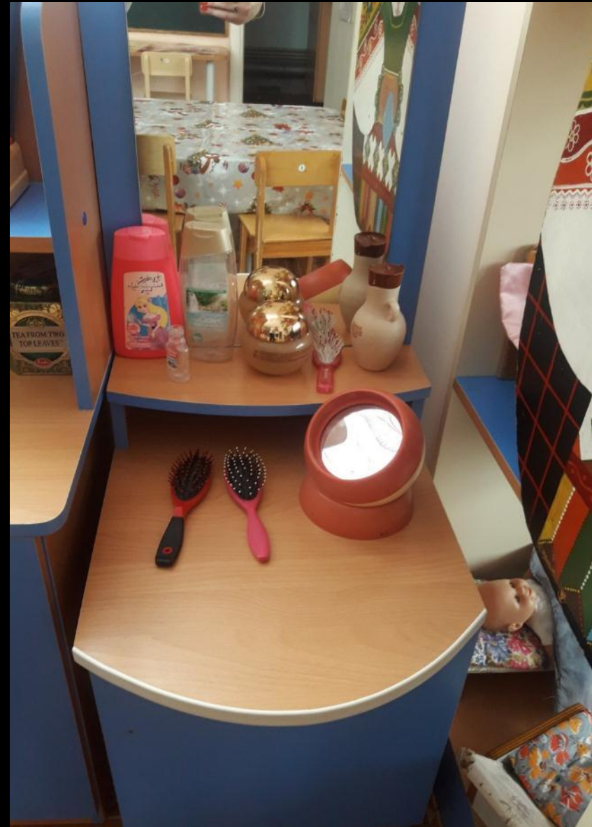
сюжетно-ролевая игра «Парикмахерская»