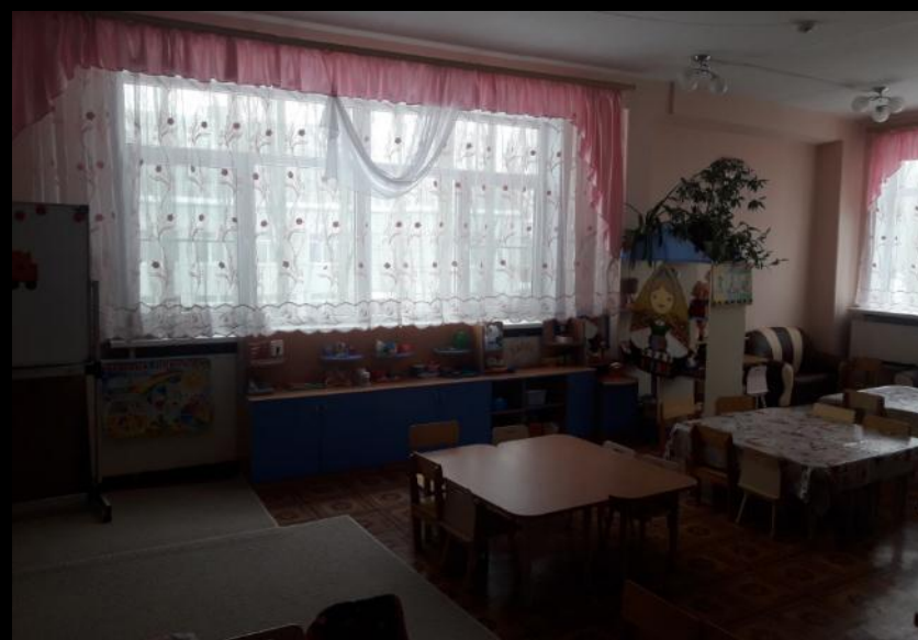
Нижняя правая точка

Групповое помещение (младший возраст) группы с четырех точек по периметру