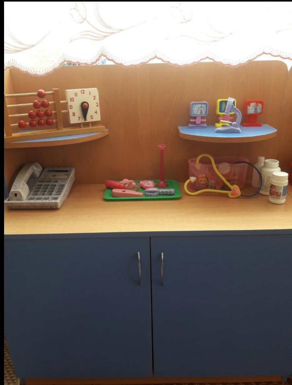
сюжетно-ролевая игра «Больница»