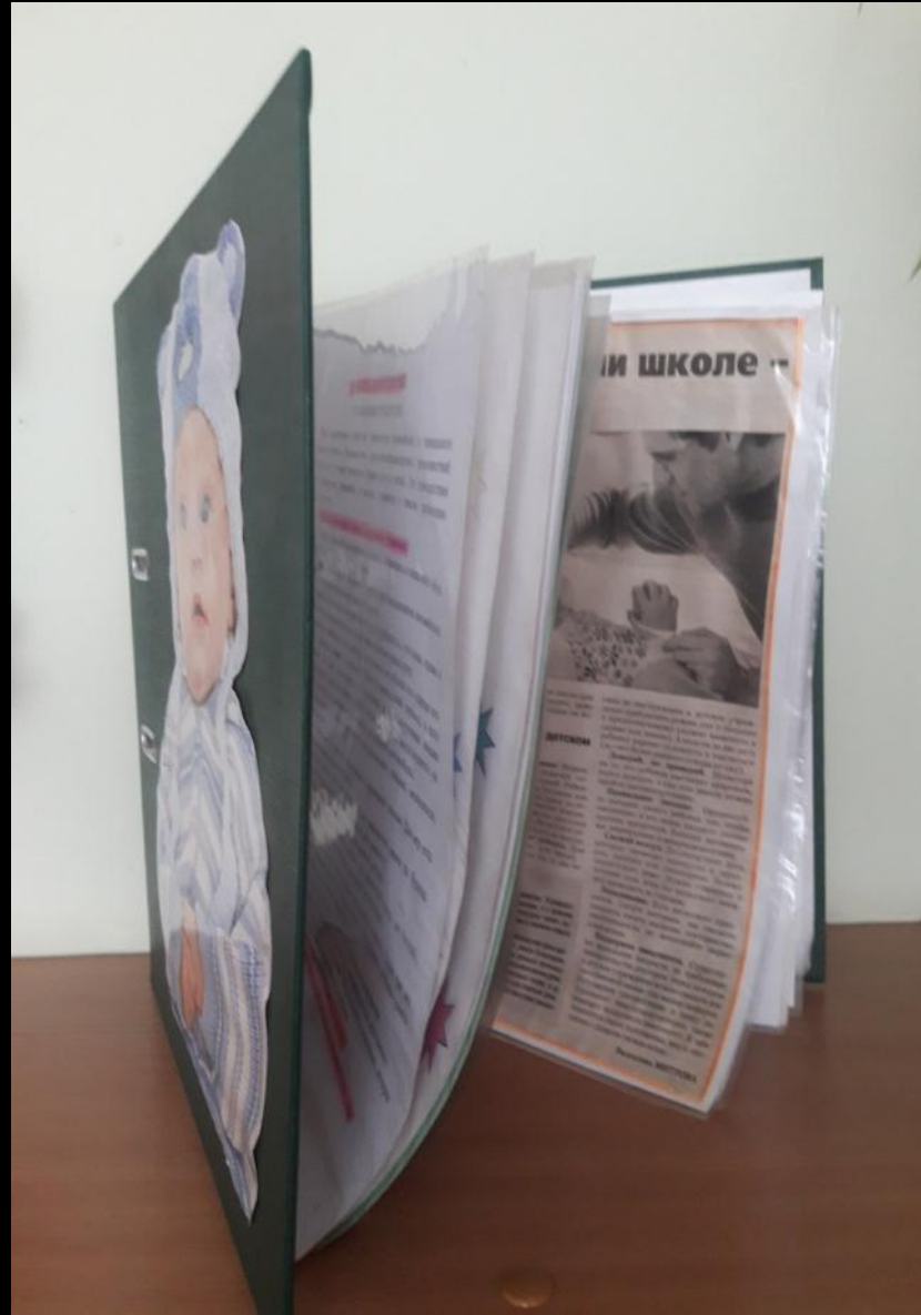
Среда для диалога с родителями (консультационный центр)