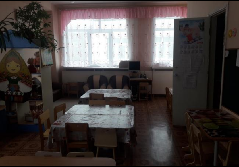
Вид группы с разных углов