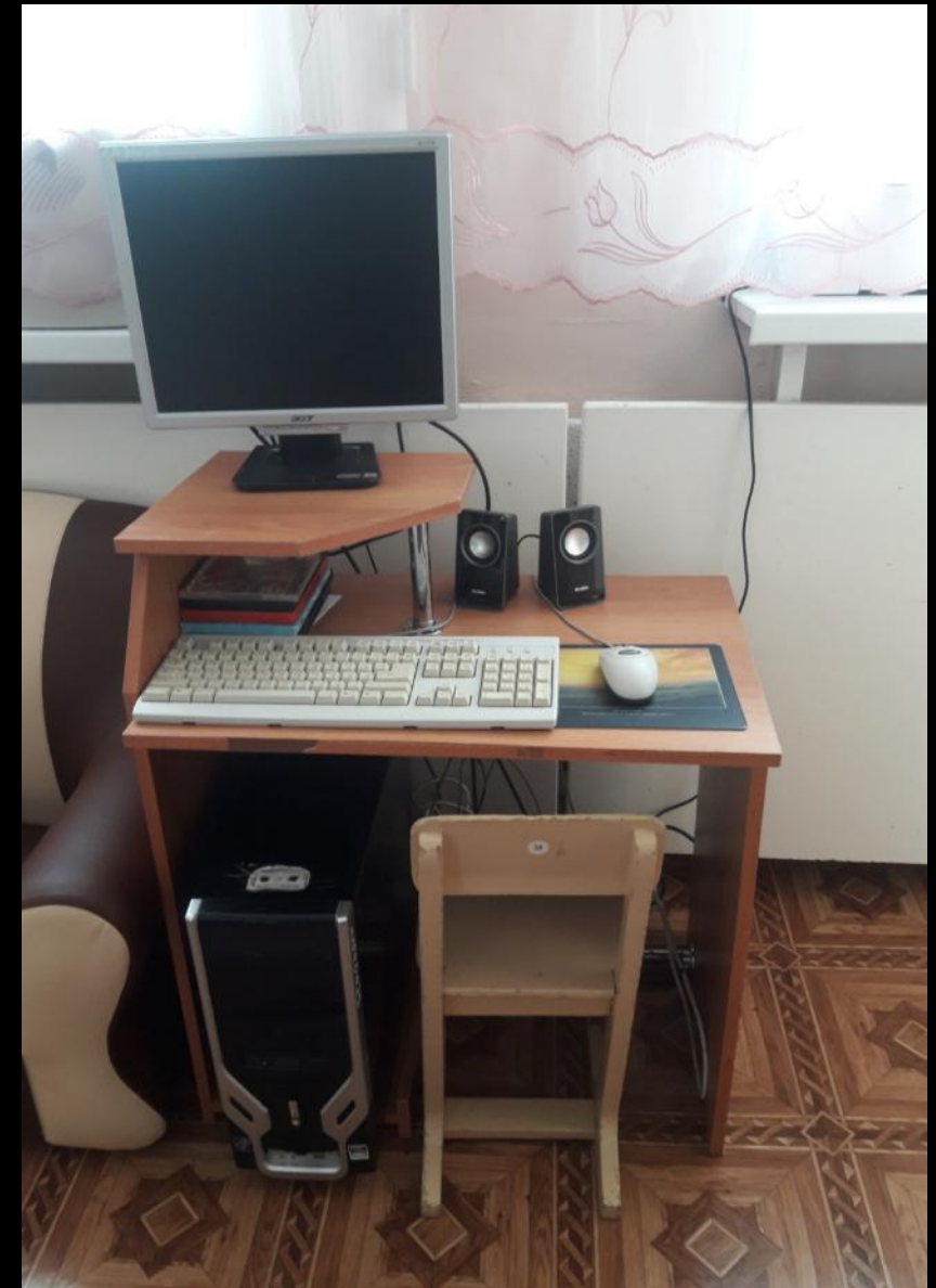
1.7. Рабочий сектор (ИКТ для педагога)