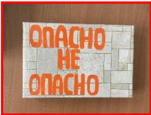
Д/И «Опасно не опасно»

В центре по обучению ПДД подобраны различные игровой материал, дидактические игры для самостоятельной и индивидуальной деятельности