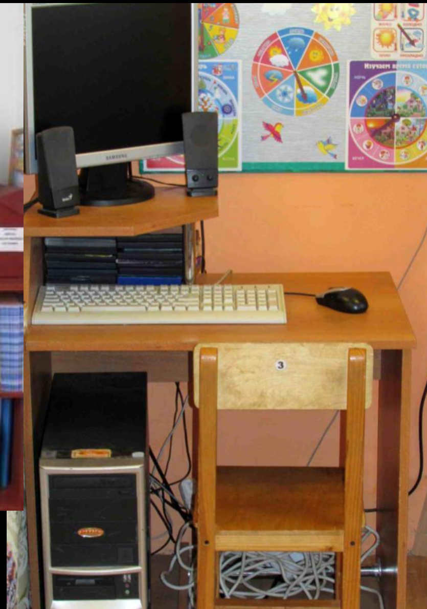
Рабочий сектор (ИКТ для педагога)