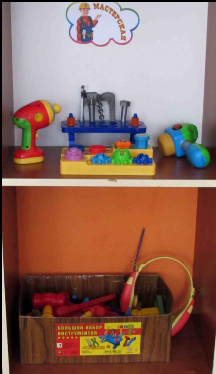
Сюжетно-ролевая игра «Мастерская»