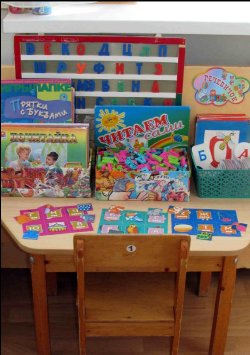
Уголок развития речи