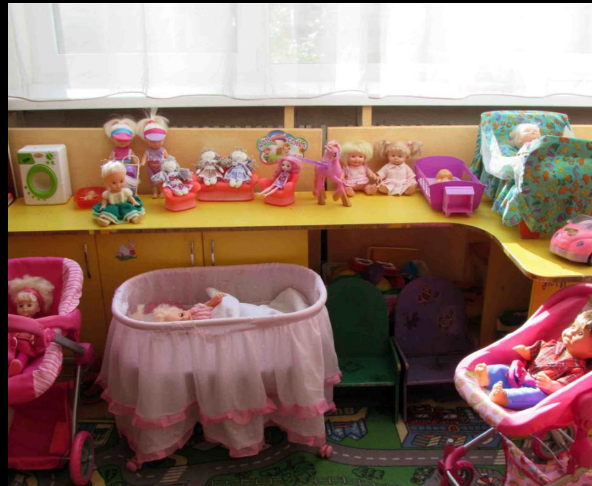
Сюжетно-ролевая игра «Дом и семья»