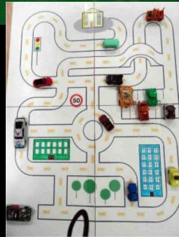
Макеты проезжей части