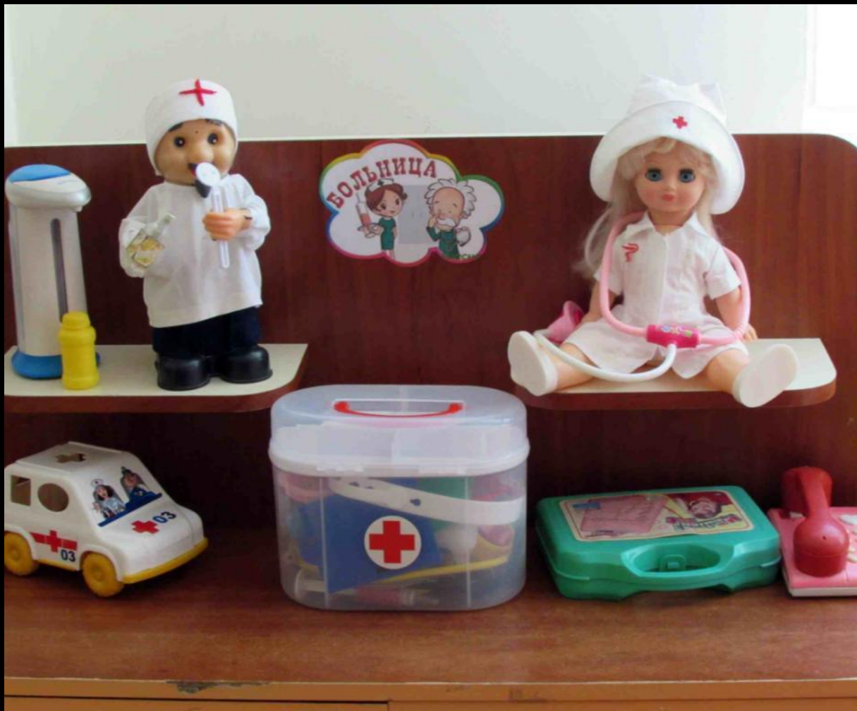
Сюжетно-ролевая игра «Больница»