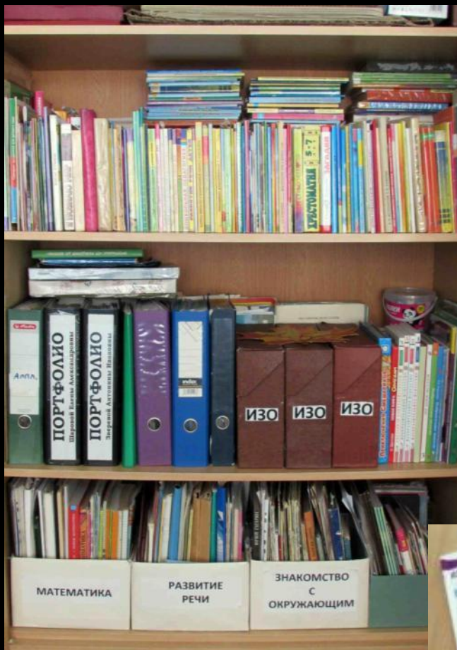
Рабочий сектор (методическая литература педагога)