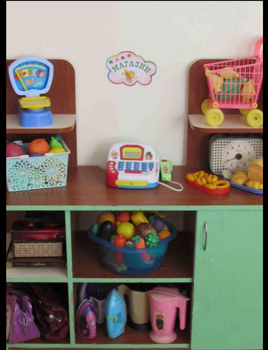
Сюжетно-ролевая игра «Магазин»