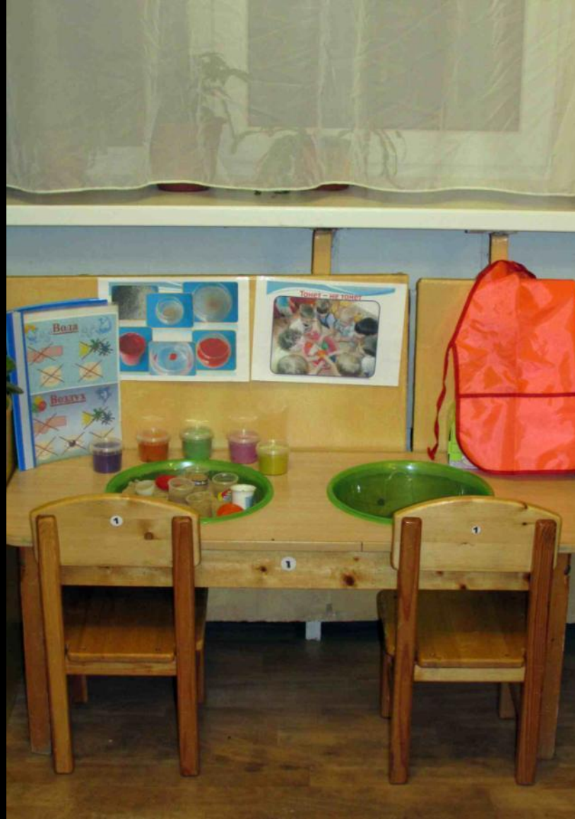
Центр воды и песка