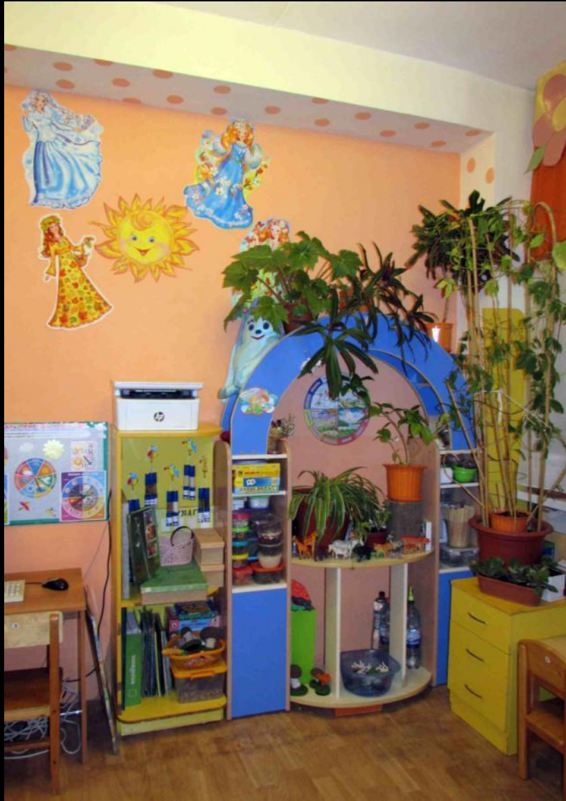
Уголок природы и экспериментальной деятельности