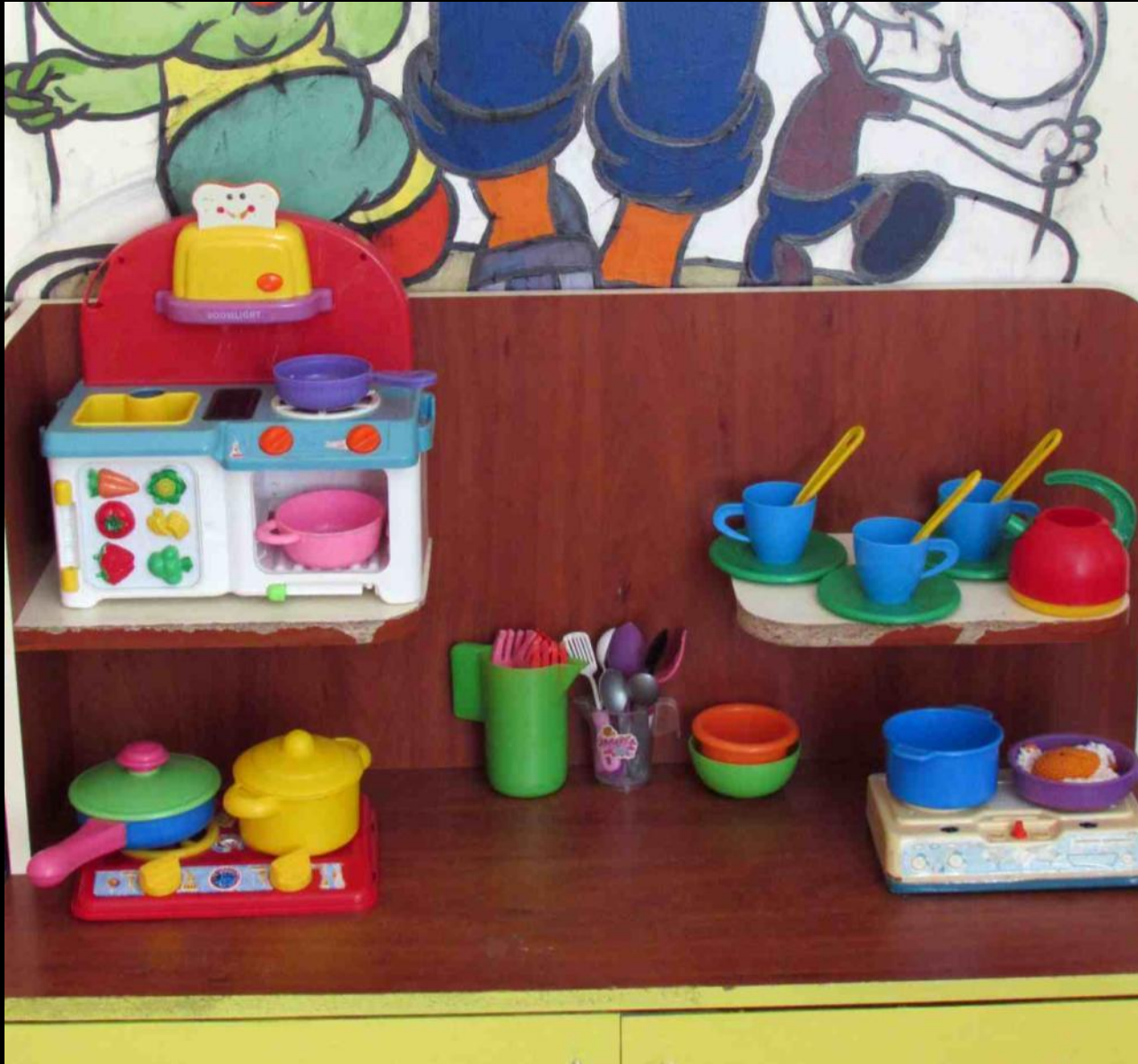
Сюжетно-ролевая игра «Кухня»