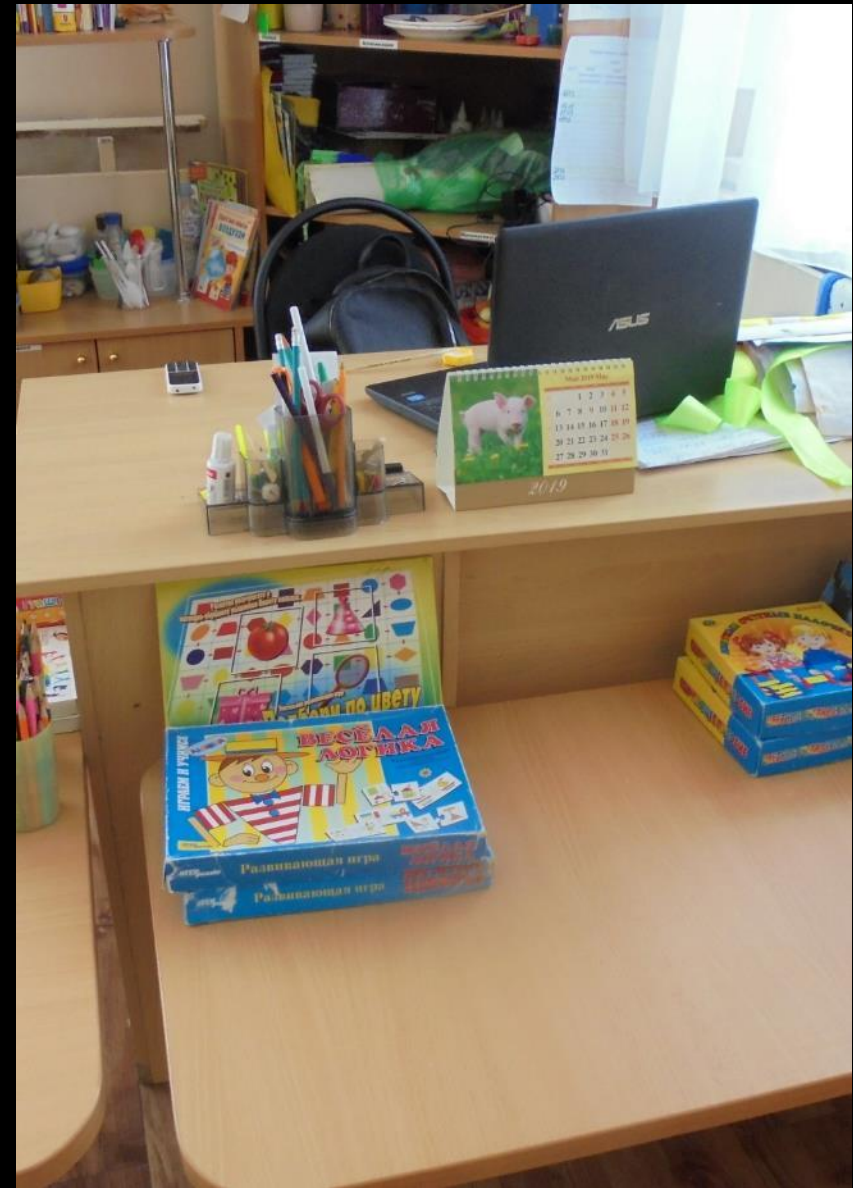
1.7. Рабочий сектор (ИКТ для педагога)