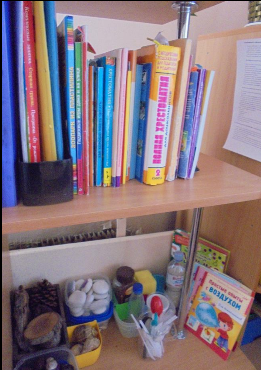
1.6. Рабочий сектор (методическая литература педагога)