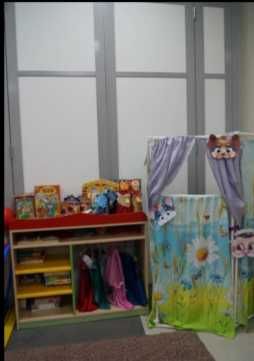
2.2.5. Активный сектор