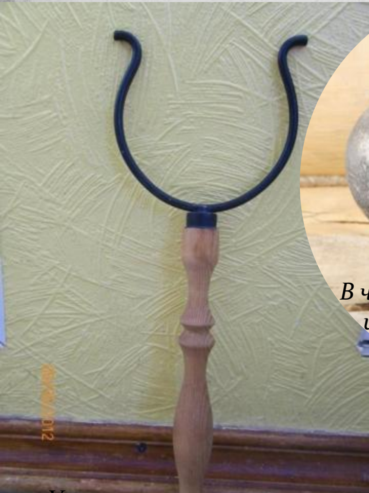
Ухват, им отправляли в жар горшки с пищей.