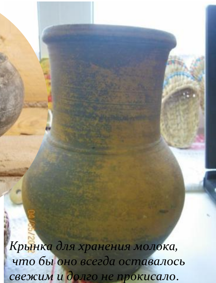
Крынка для хранения молока, что бы оно всегда оставалось свежим и долго не прокисало.