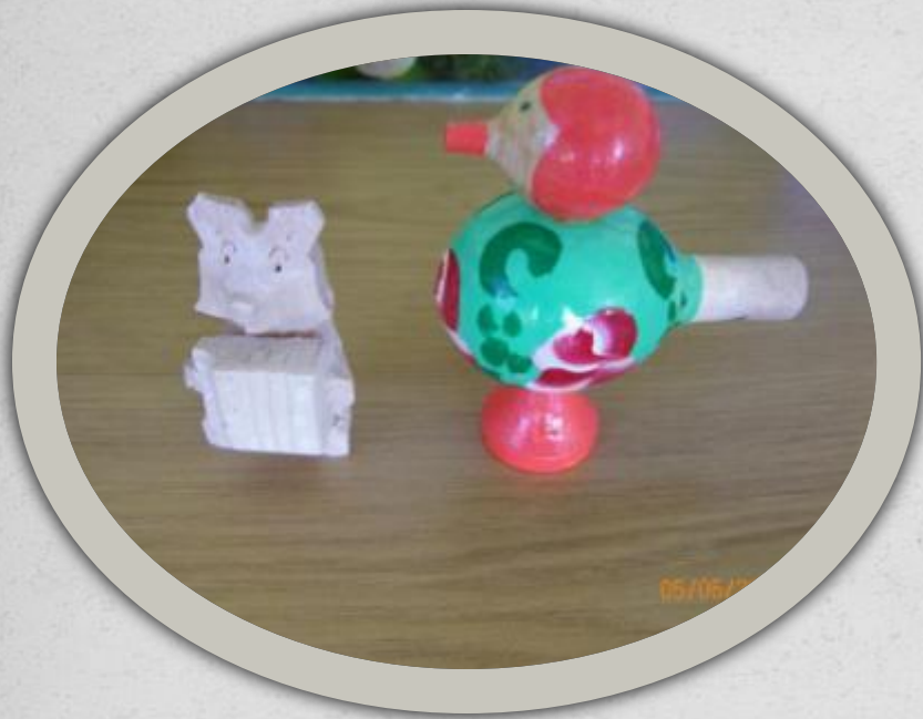
Деревянные свистульки и фигурки животных.