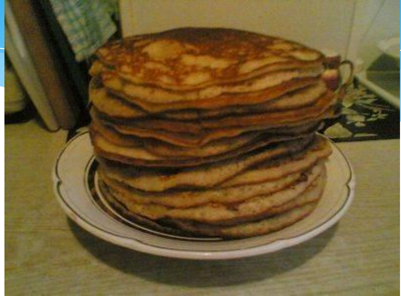
Начинают печь блины.