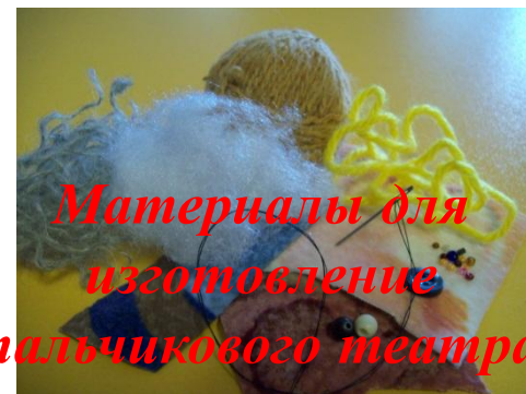
Материалы для изготовления пальчикового театра