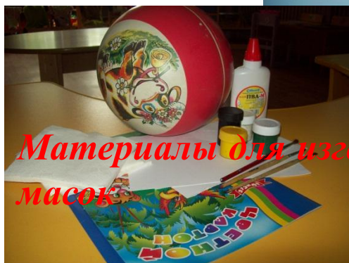
Материалы для изготовления масок