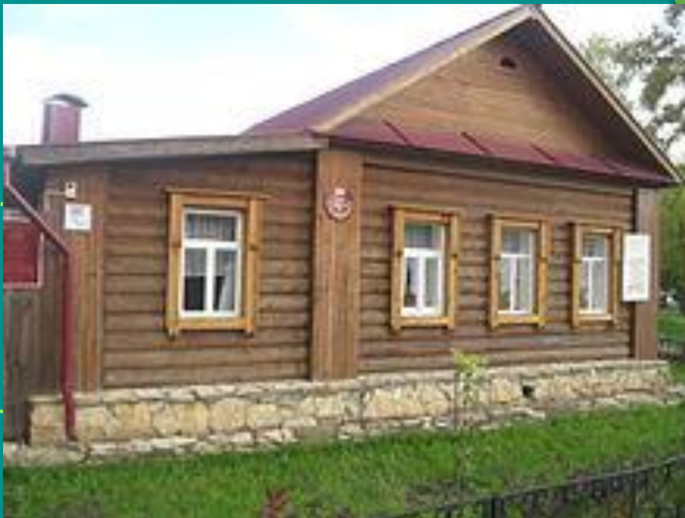
городок Елабугу на Каме.