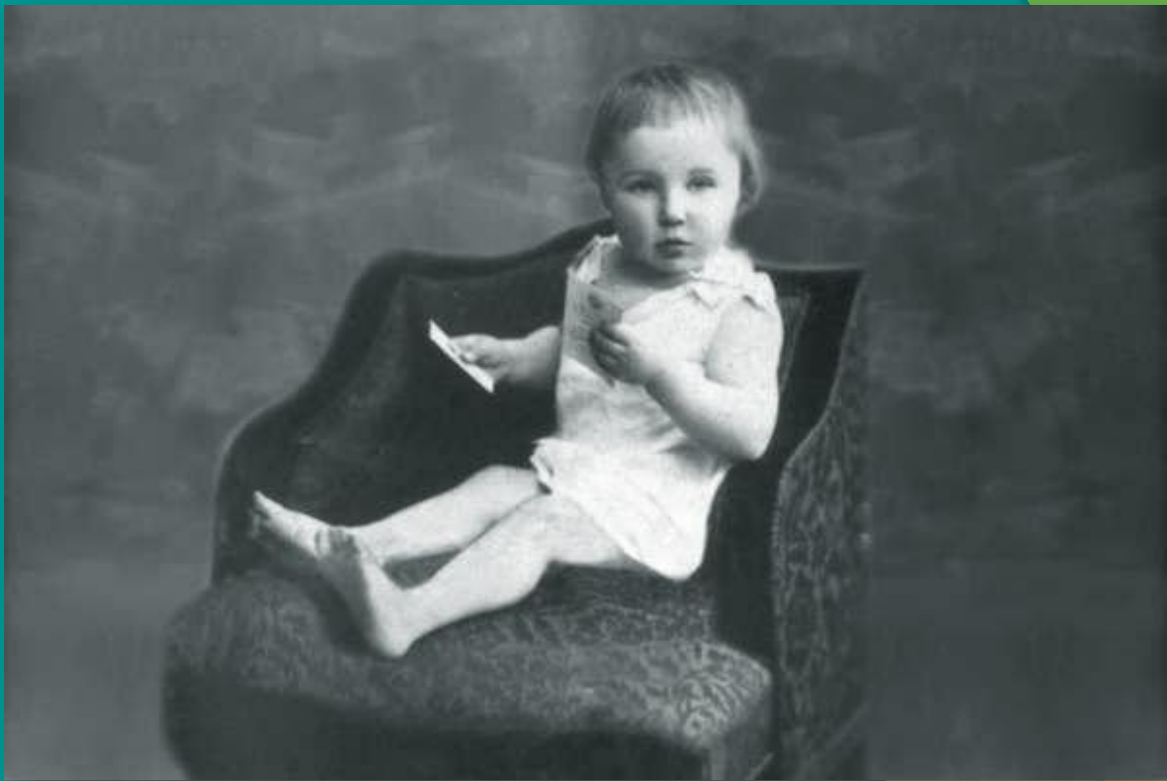
Марина Цветаева в детстве 1893