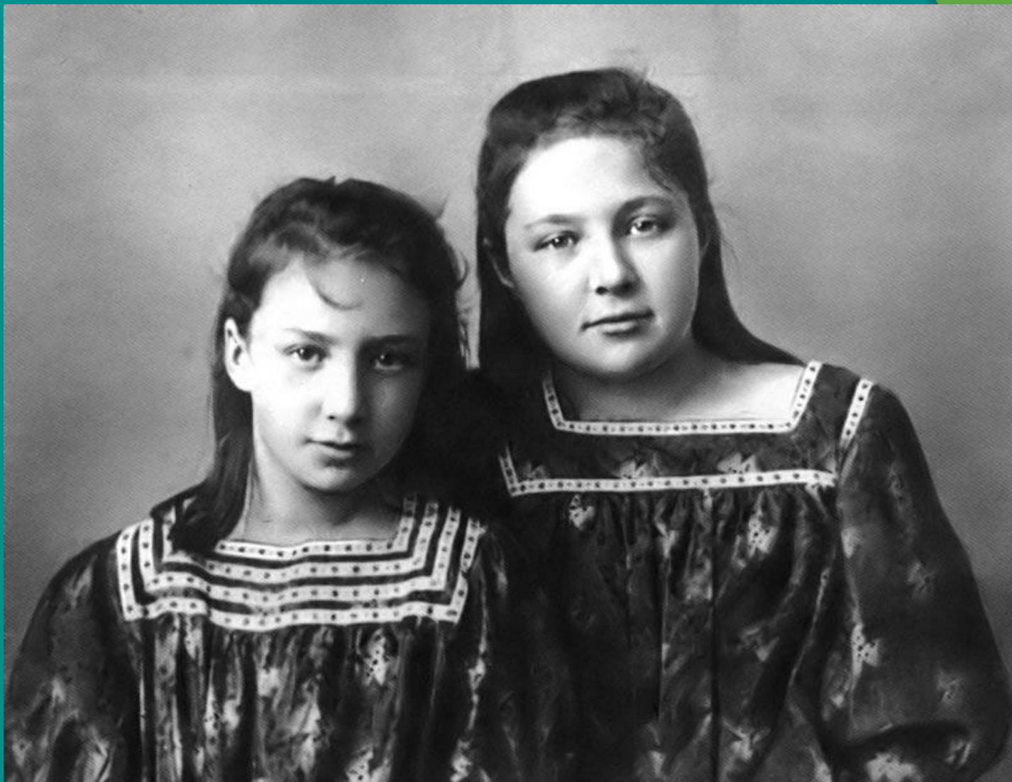
Анастасия (слева) и Марина Цветаевы. Ялта, 1905.