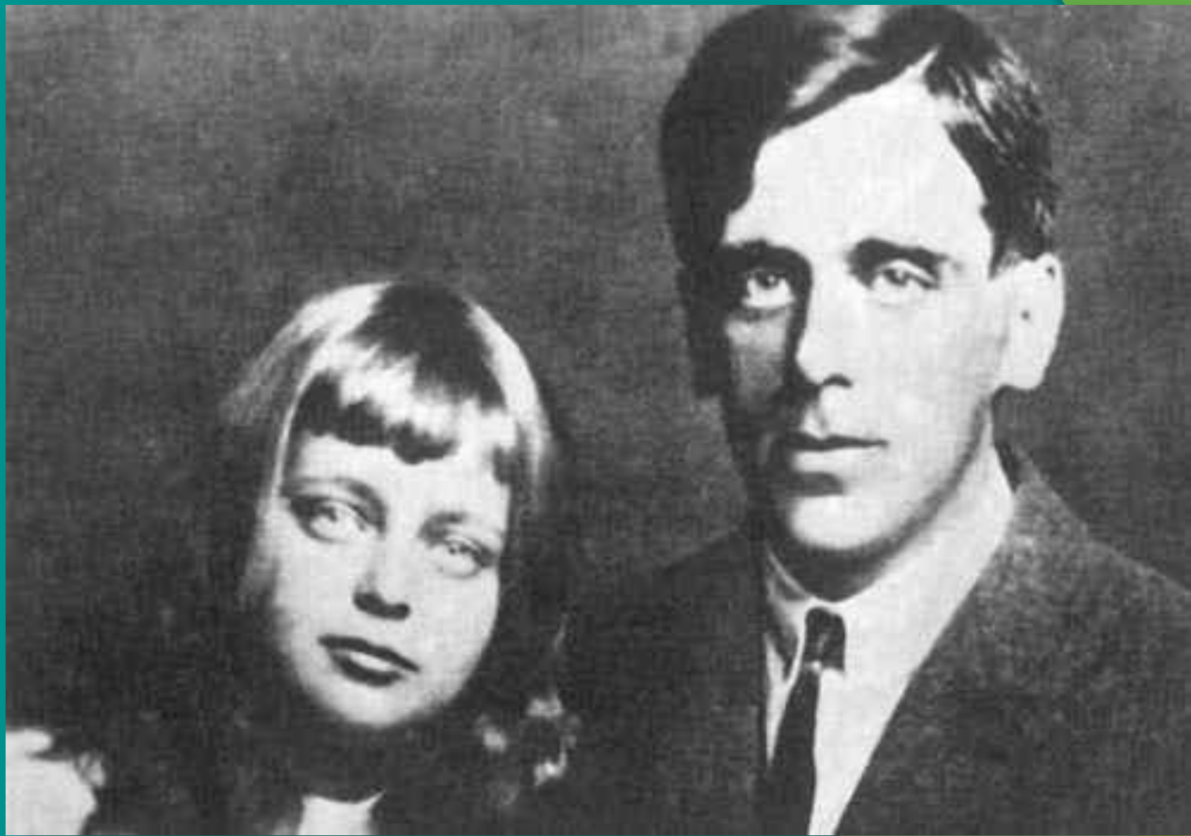
Сергей Эфрон с дочерью Ариадной 1925