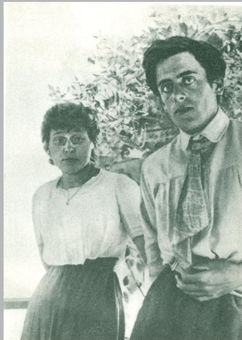
Марина Цветаева и Сергей Эфрон. Коктебель, 1911

Сергей Яковлевич Эфрон родился 26 сентября 1893 в Москве; репрессирован, расстрелян 16 августа 1941 в Москве. Русский публицист, литератор, офицер Белой