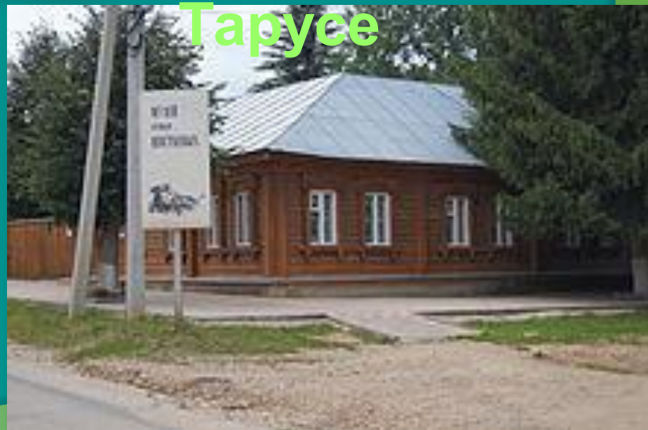
Музей в Тарусе