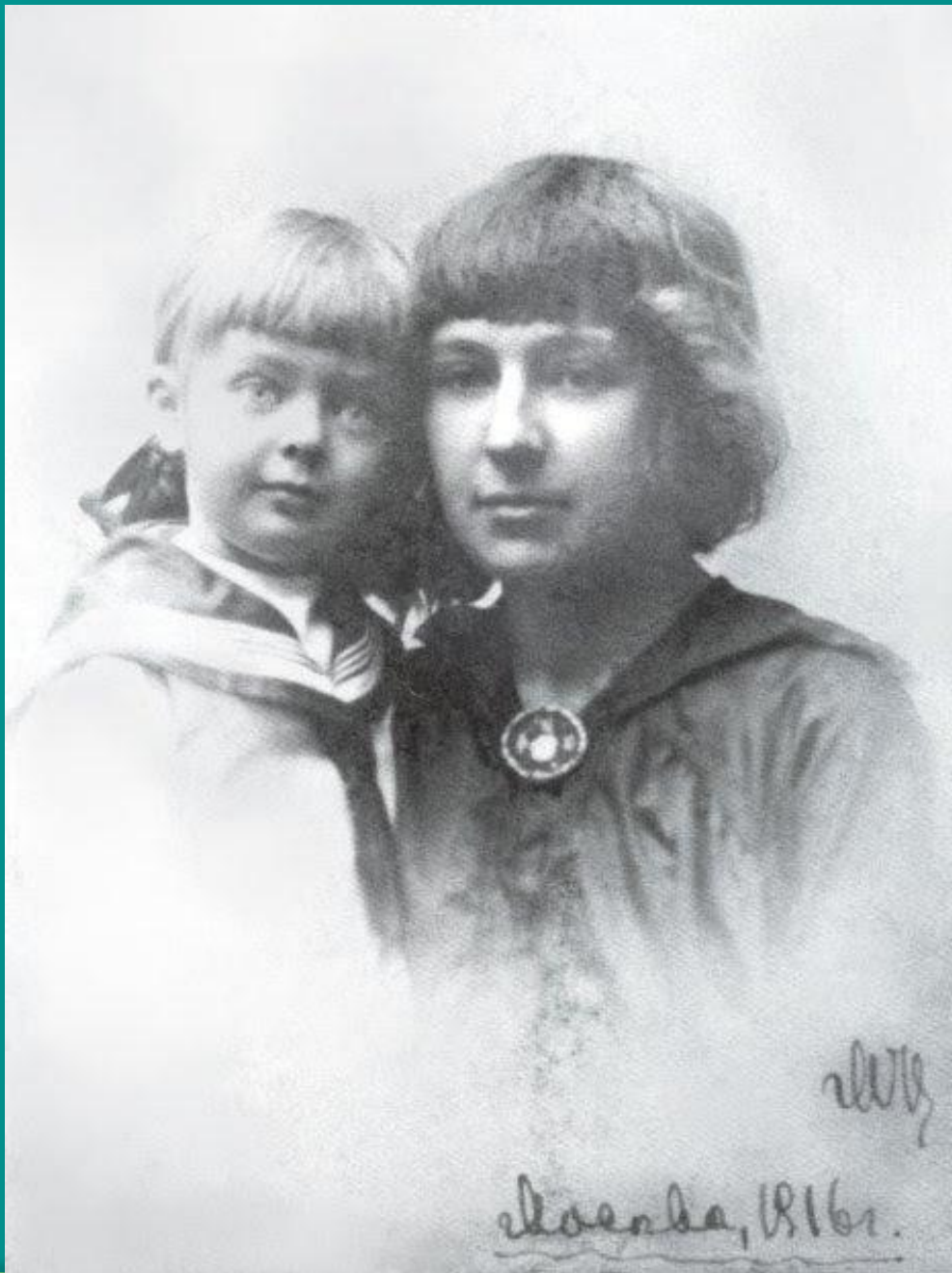
Марина Цветаева с дочерью Алей. 1916