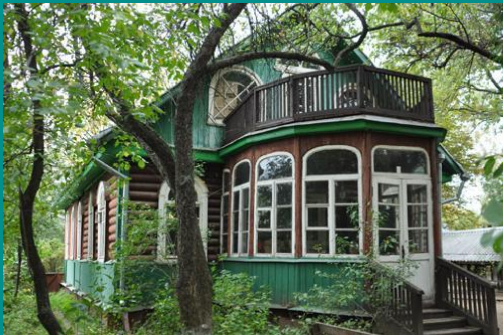
Дом-музей в Болшеве