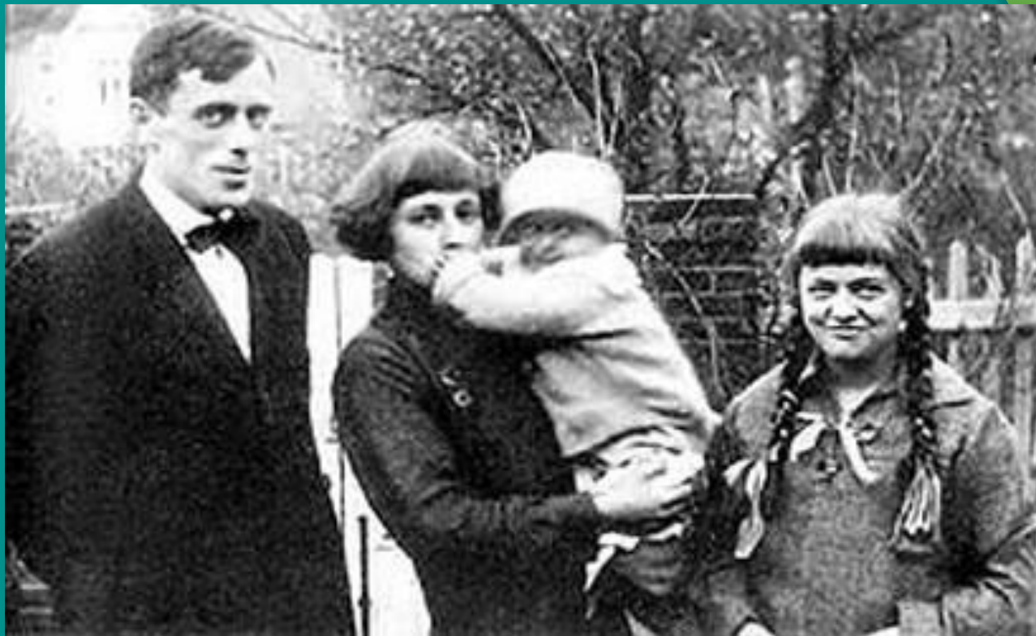
Семья Цветаевой, 1925