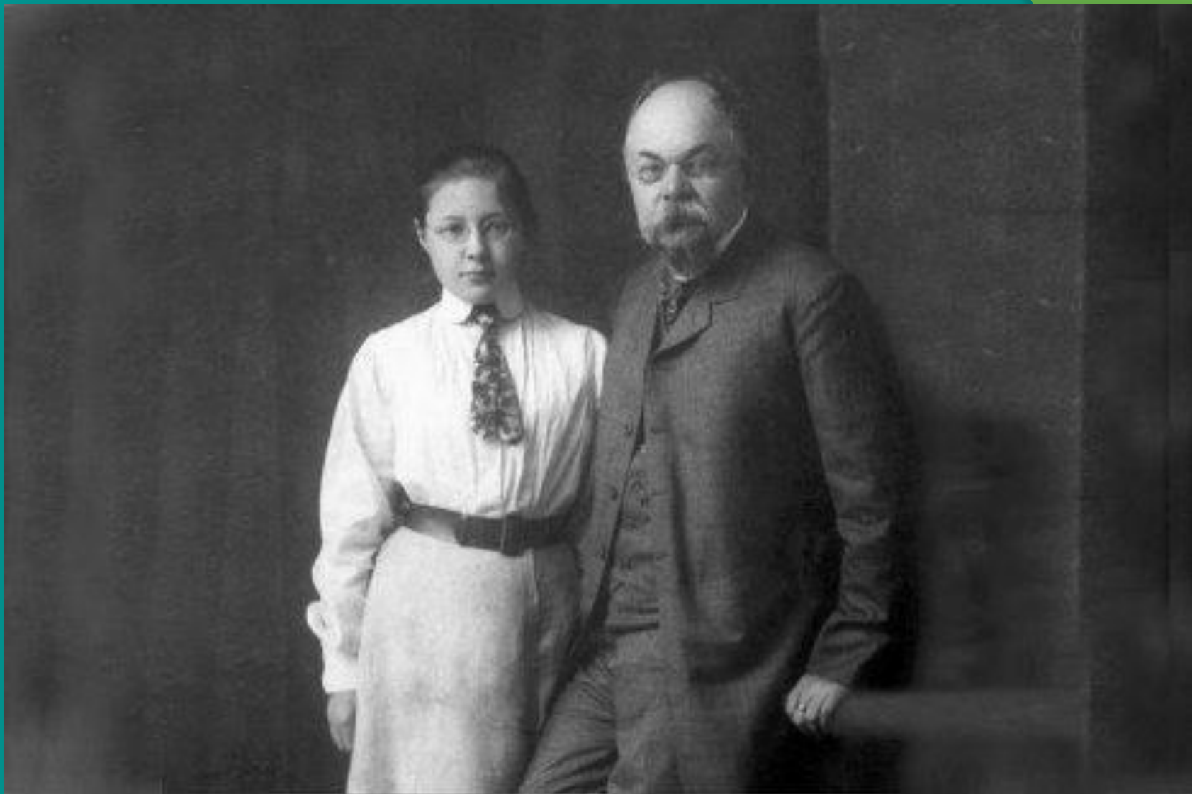
Марина Цветаева с отцом. 1906