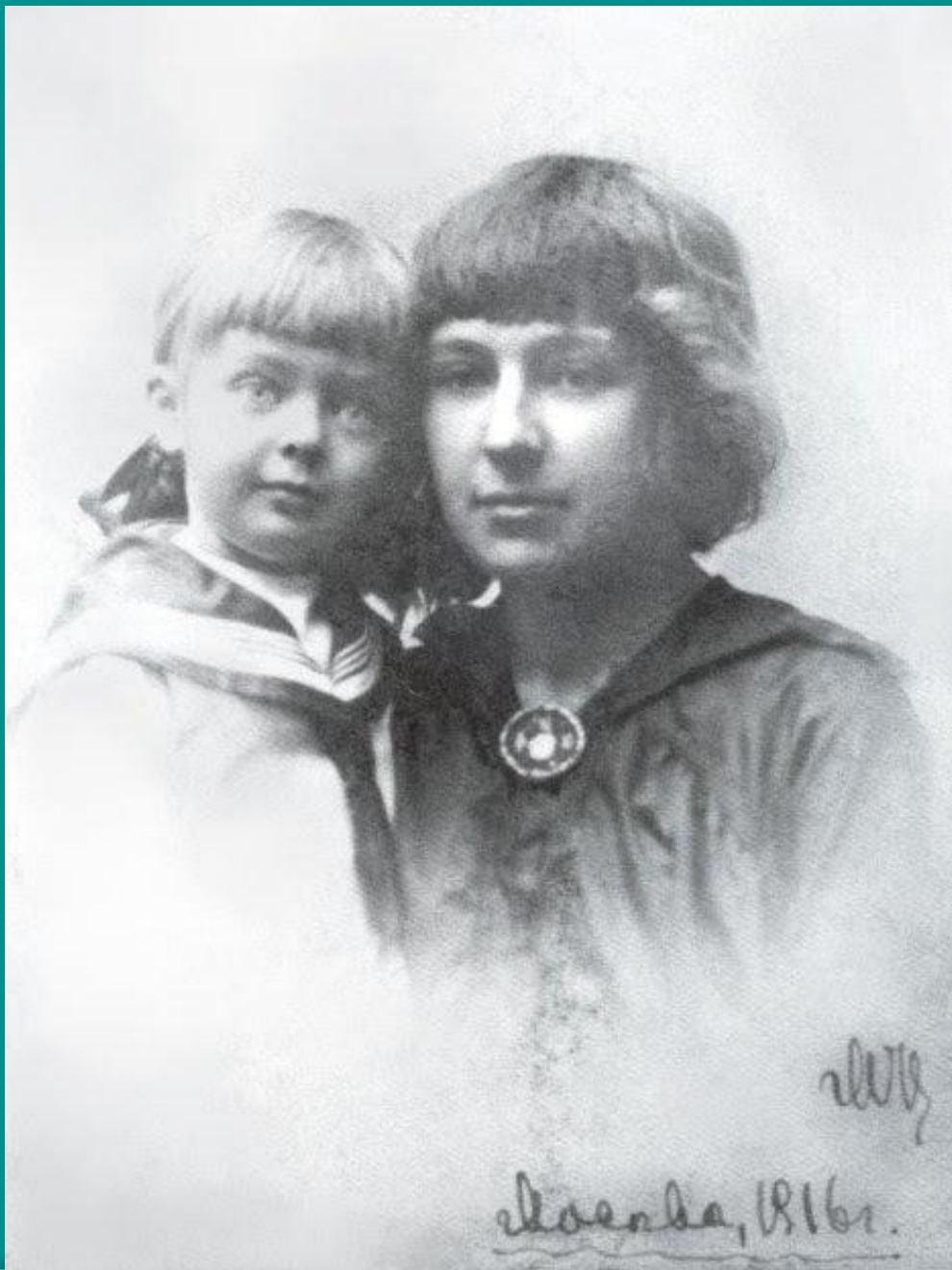
Марина Цветаева с дочерью Алей. 1916