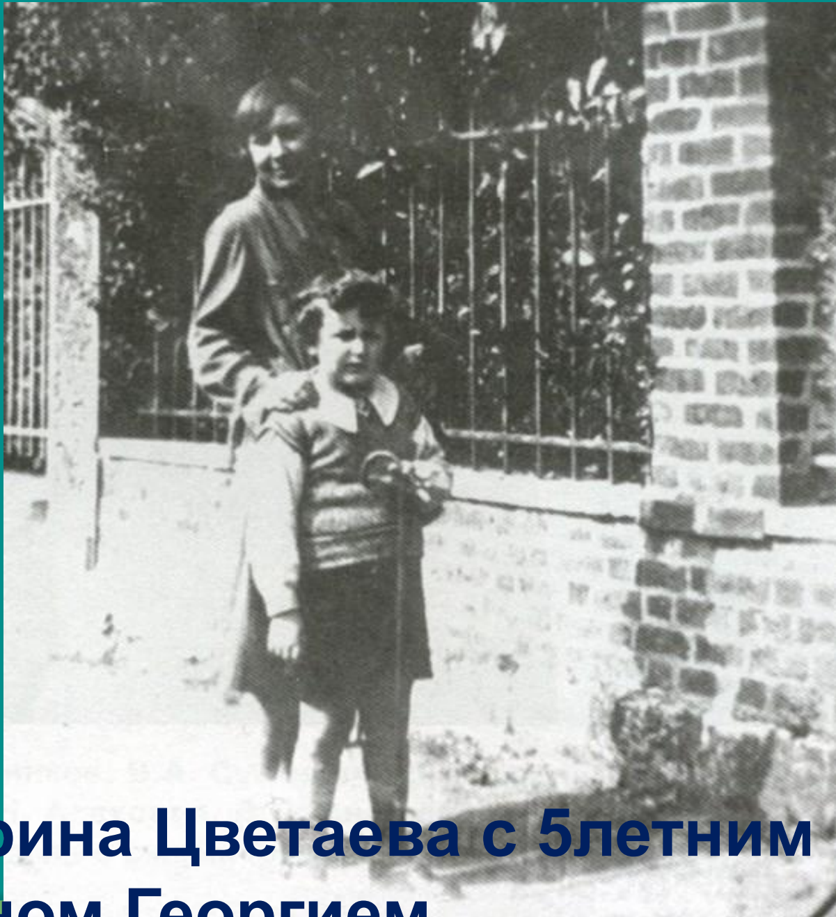
Марина Цветаева с 5летним сыном Георгием