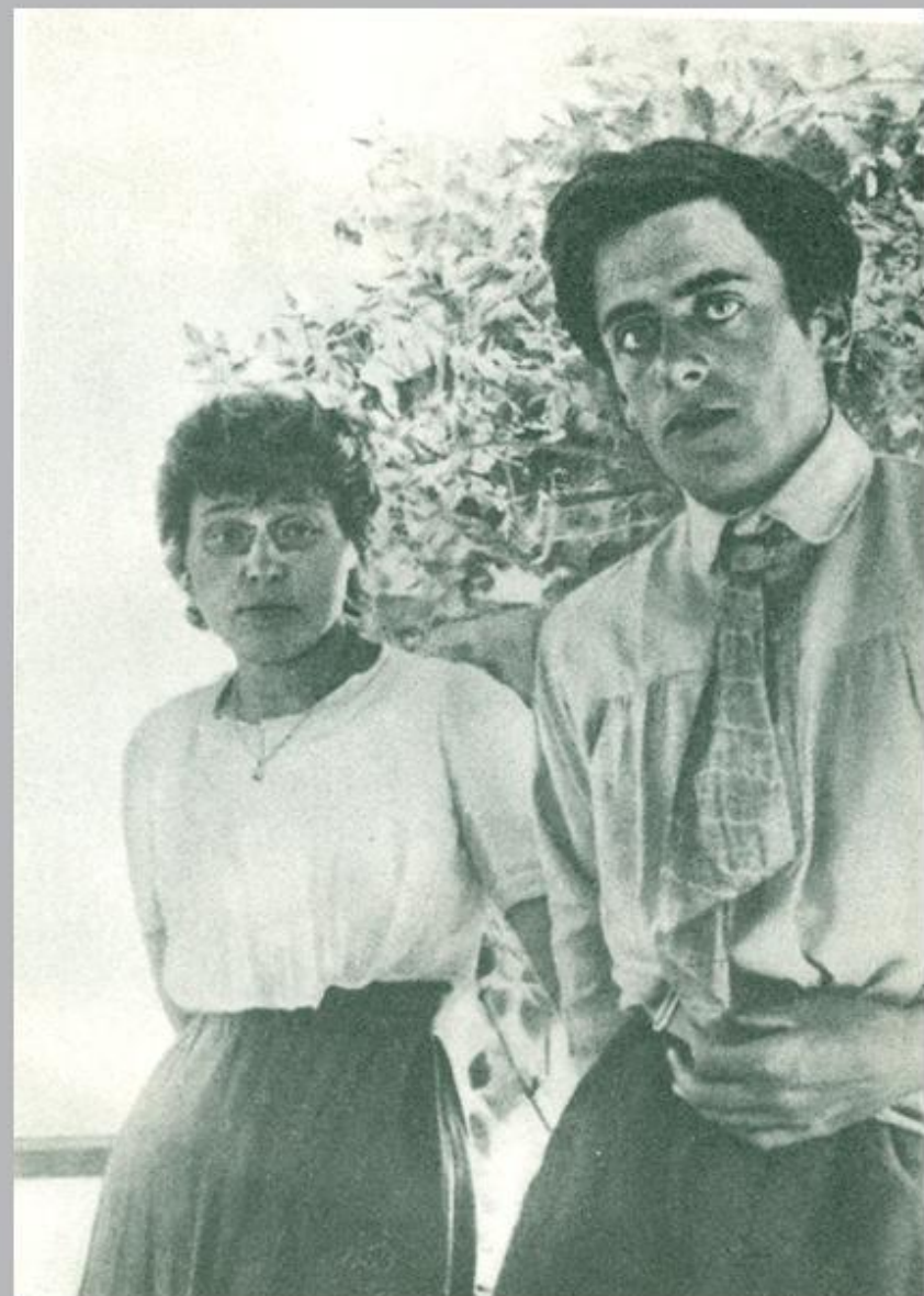
Марина Цветаева и Сергей Эфрон. Коктебель, 1911

Сергей Яковлевич Эфрон родился 26 сентября 1893 в Москве; репрессирован, расстрелян 16 августа 1941 в Москве. Русский публицист, литератор, офицер Белой