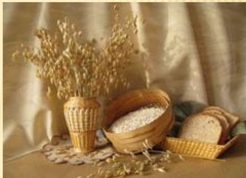
Символы праздника – овёс, лубок с зерном и домашний хлеб