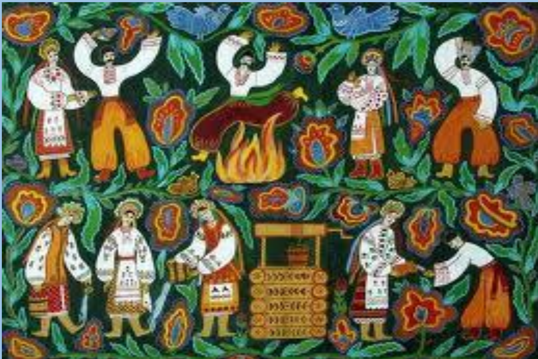
Русские обычаи. Праздник Ивана Купалы.