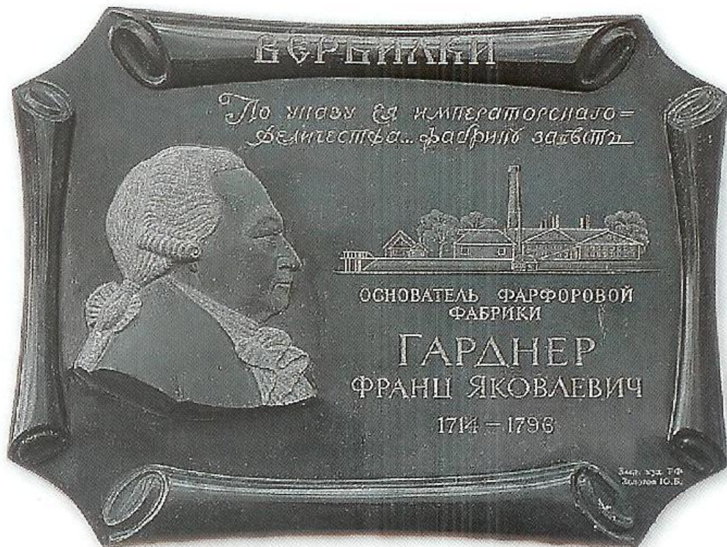
Памятная доска в честь Франца Яковлевича Гарднера