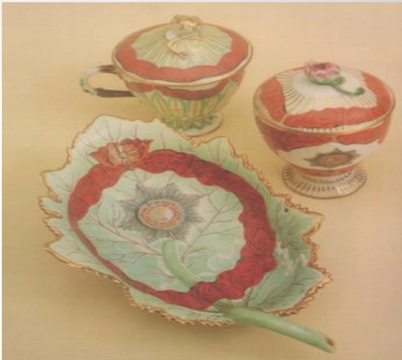
Детали сервиза ордена Александра Невского. 1780 г.