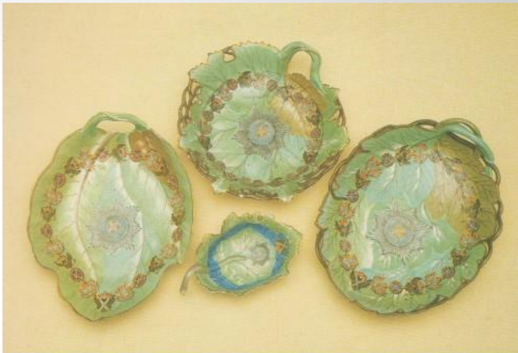
Детали сервиза ордена Андрея Первозванного. 1780