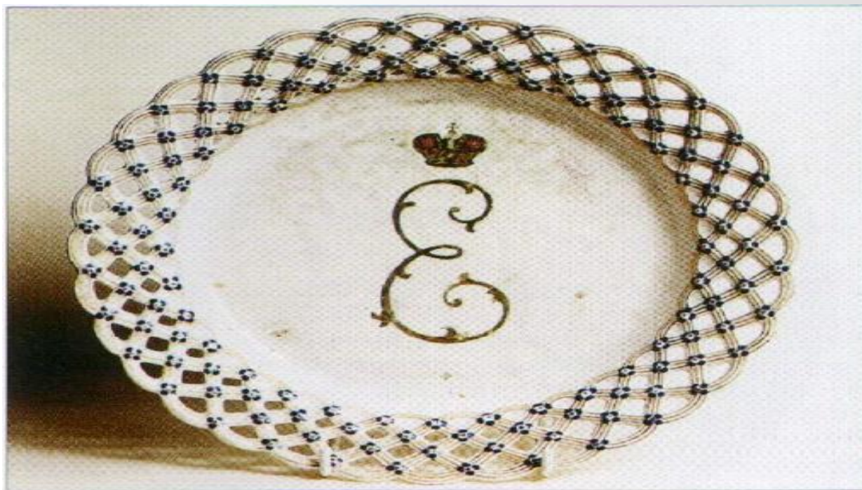
Тарелка с прорезным бортом и вензелем великой княгини Екатерины Алексеевны. ИФЗ. С-Петербург. Середина 1750-х гг. Фарфор, надглазурная роспись, золочение. Частная коллекция. Москва.

Самый известный, окончательный вариант вензеля императрицы Екатерины 2 представлял собой крупно прописную букву Е, пересеченную в средней части римской цифрой 2, иногда под золотой императорской короной.