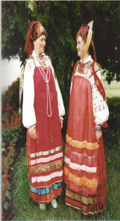
Костюмы с головными уборами «поправа» и «псыважан» из «цветкового» платна. Село Меловое, Раптянский район.

Передники–запоны («занавески», «завесы») имеют удивительное своеобразие в Белгородском костюме. Завесы надевались поверх рубахи с поневой, оставляя открытыми узорные рукава рубахи.