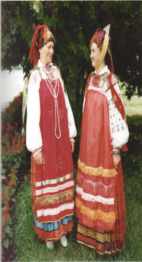
Костюмы с головными уборами «поправа» и «псыважан» из «цветкового» платна. Село Меловое, Раптянский район.

Среди особо почитаемых на Руси предметов одежды – пояс . На Белгородчине его называют «подпояска». Круг – оберег, считалось, что пояс увеличивает силу человека, оберегает его от напастей.