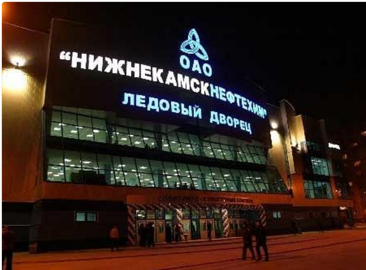
Ледовый дворец вечером