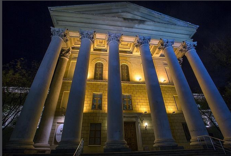
Физический институт имени Лебедева

22 октября 1986 года Сахаров просит прекратить его депортацию и ссылку жены, снова обещая закончить свою общественную деятельность. 23 декабря 1986 года вместе с Еленой Боннэр Сахаров возвращается в Москву. После возвращения он продолжил работать в Физическом институте им. Лебедева в должности главного научного сотрудника.