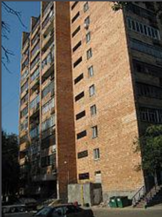
Дом, где Сахаров жил в Горьком (Нижний Новгород, район Щербинки)

«Духовный отщепенец, провокатор Сахаров всеми своими подрывными действиями давно поставил себя в положение предателя своего народа и государства!» («Комсомольская правда», 15.02.1980)