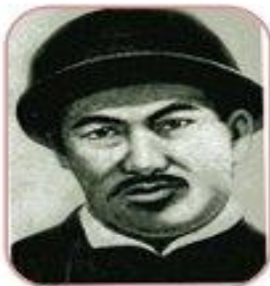
Ақан сері (Ақжгігіт) Қорамсаулы (1843-1913)