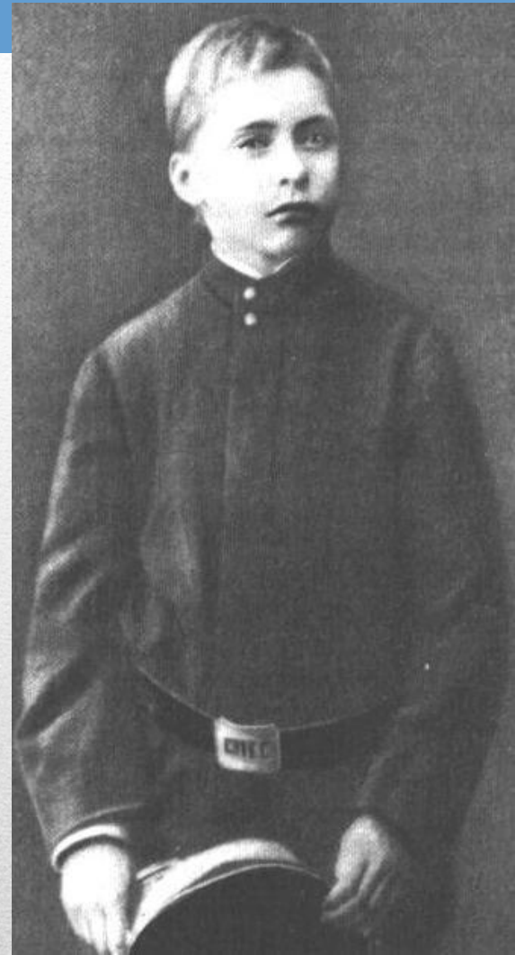
ДОЧЬ И СЫН М. Е. Салтыкова-Щедрина