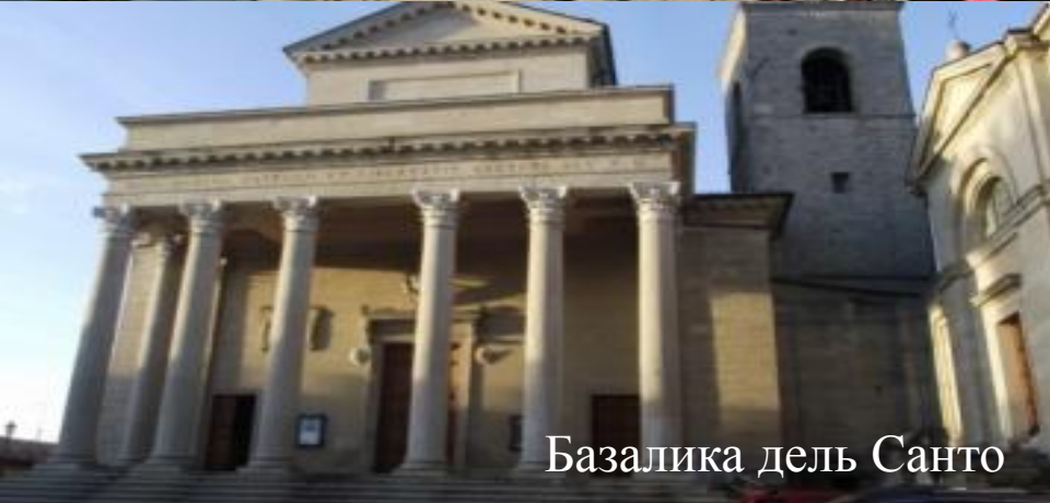
Базалика дель Санто