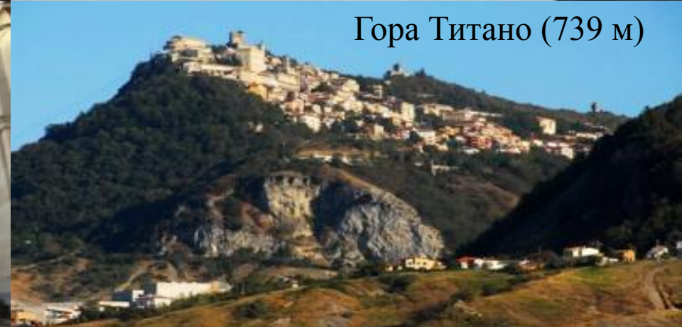
Гора Титано (739 м)