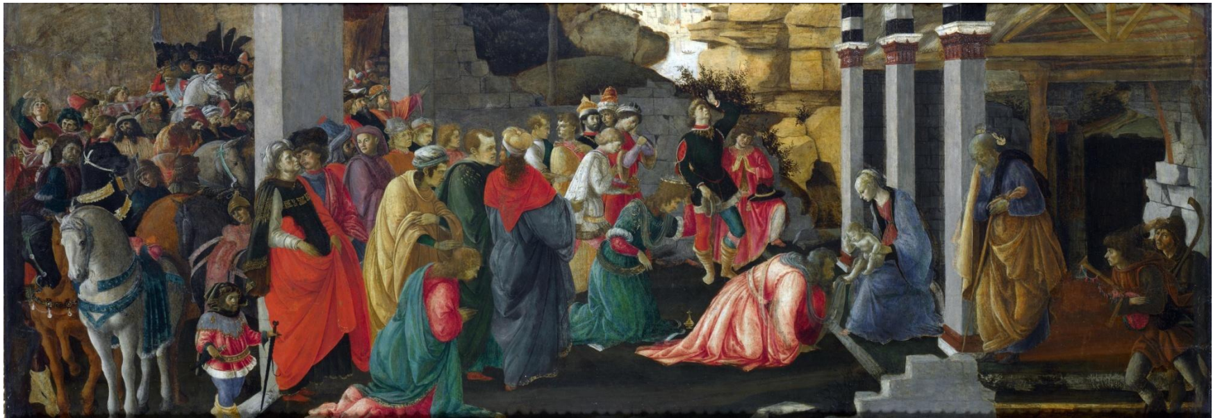
Поклонение волхвов. Около 1465-67