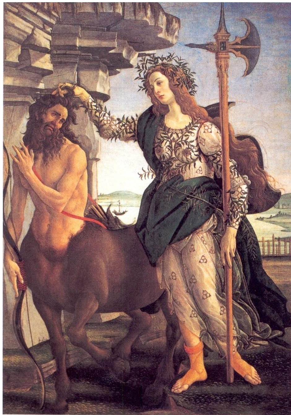
Паллада и кентавр. Около 1482.