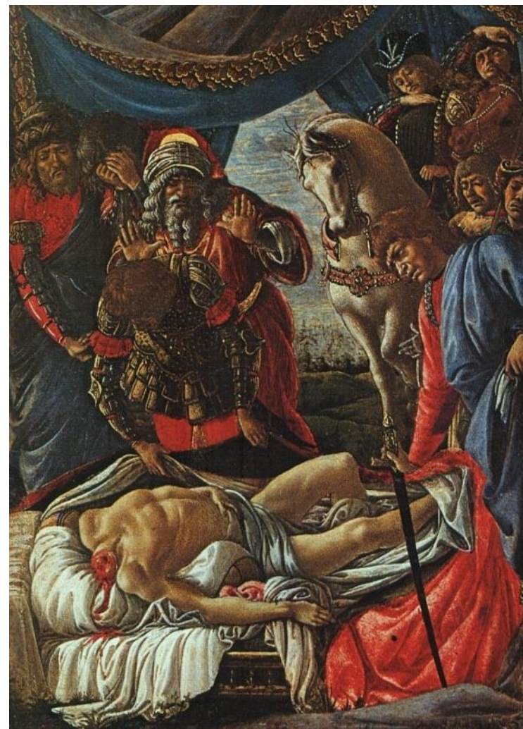
Возвращение Юдифи и Нахождение тела Олоферна. Около 1469/70