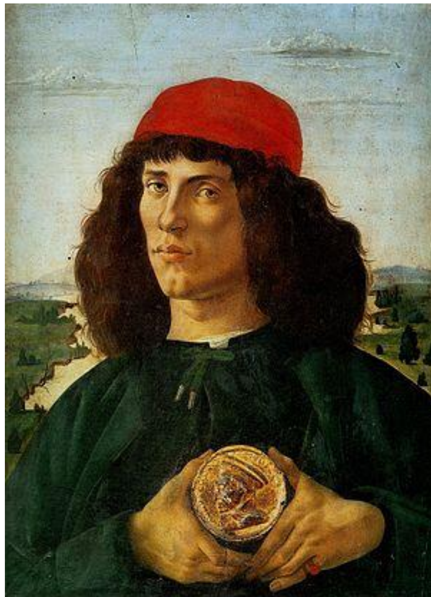
Портрет неизвестного с медалью Козимо Медичи. 1475