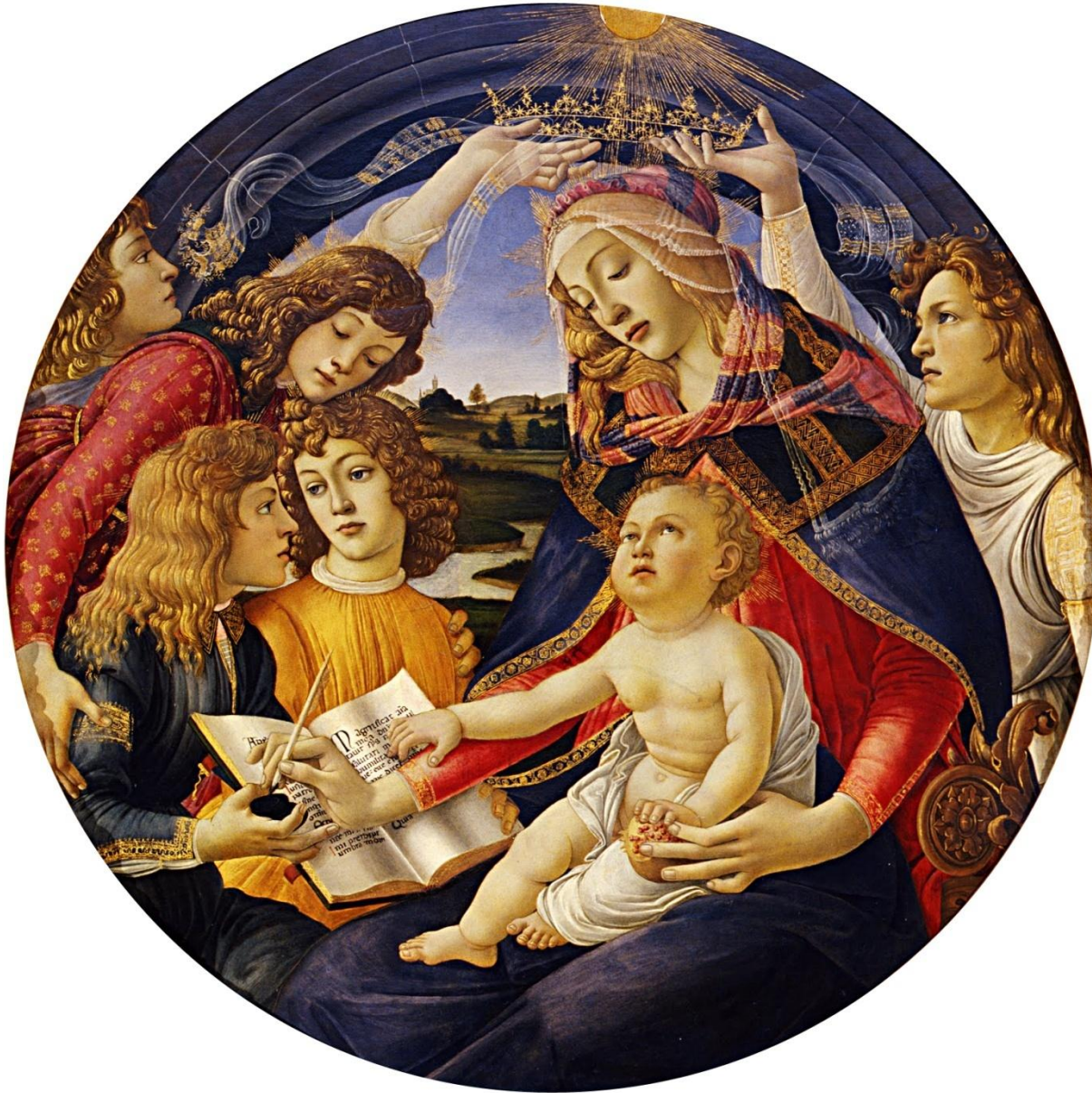
Мадонна с младенцем и пятью ангелами (Мадонна Магнификат). 1480/81