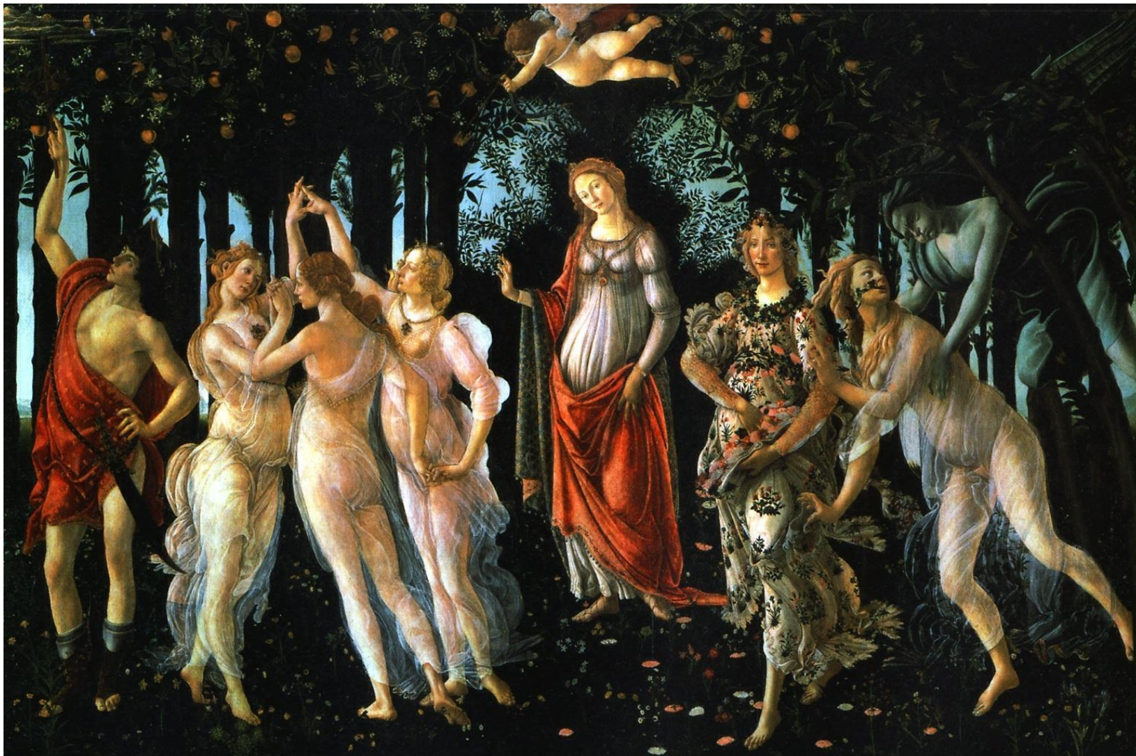
Весна. Около 1482