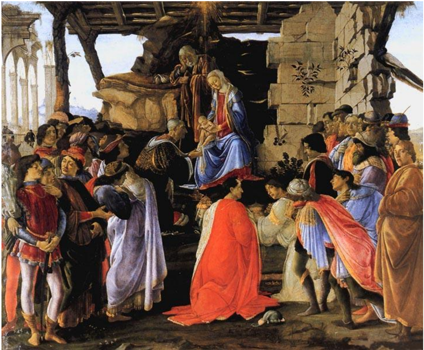
Поклонение волхвов (Поклонеине дель Ламы). Около 1475