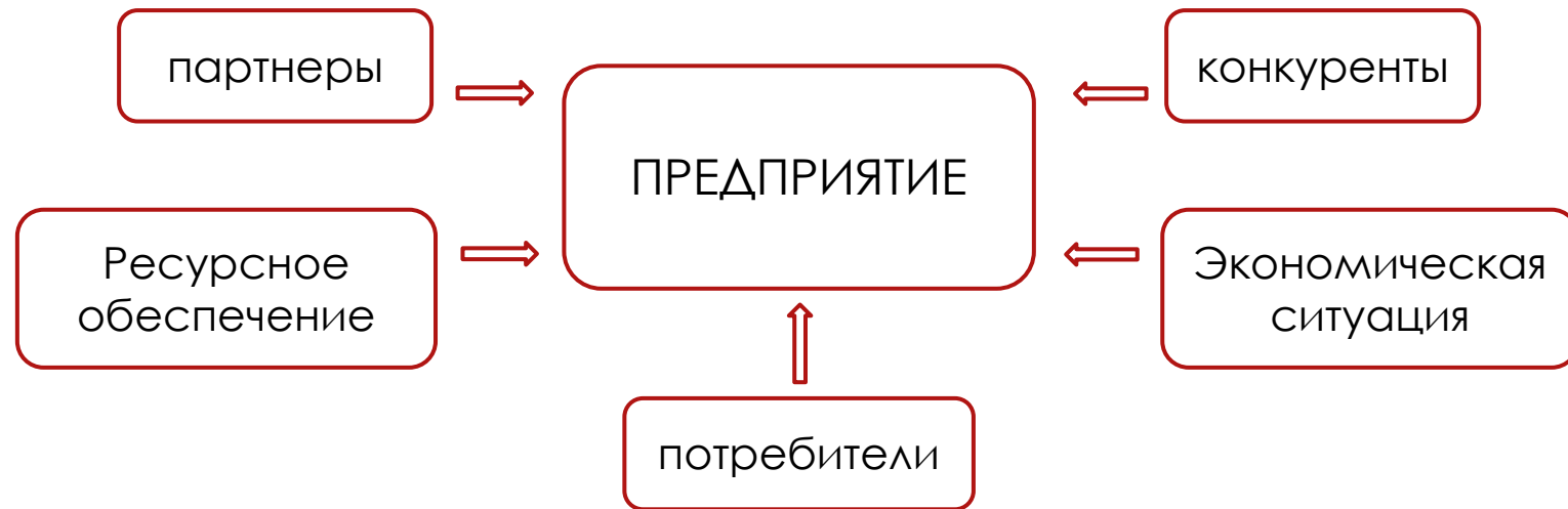
Схема действия факторов внешней среды предприятия на его устойчивое развитие

Объективные внешние факторы - совокупность факторов внешней среды, имеющая прямое воздействие на функционирование и развитие предприятия. К данной группе факторов относят поставщиков трудовых, финансовых, информационных, материальных и пр. ресурсов, потребителей, конкурентов и т.д.