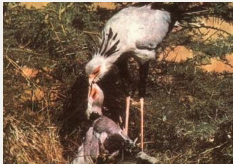
Птах-секретар годує пташеня