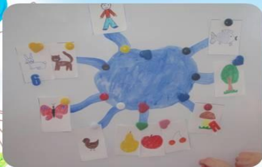
Вода необходима для всего живого