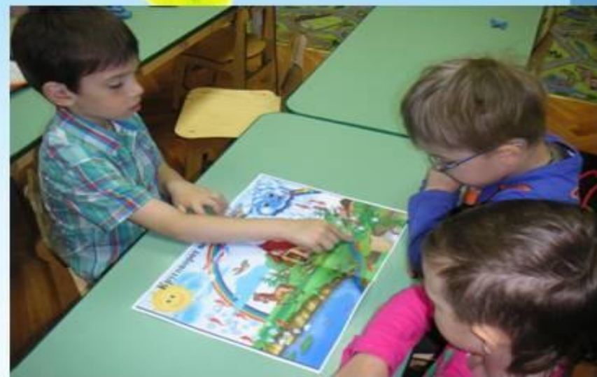
Круговорот воды в природе