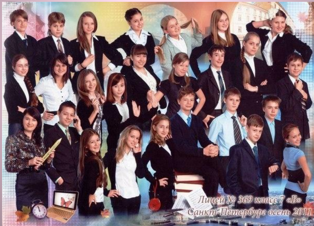
Лицей № 369 класс 7 «Б» Санкт-Петербурге осень 2011