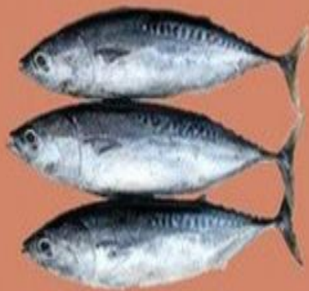
Рыба здорового человека