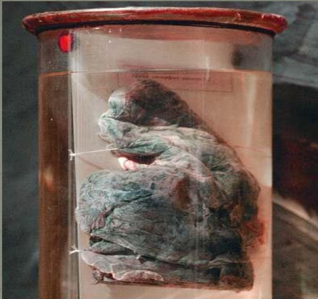
Легкие курильщика стаж 12 лет