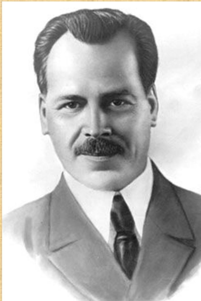
Николай Иванович Вавилов 1887-1943

Основоположник учения об иммунитете растений к инфекционным болезням