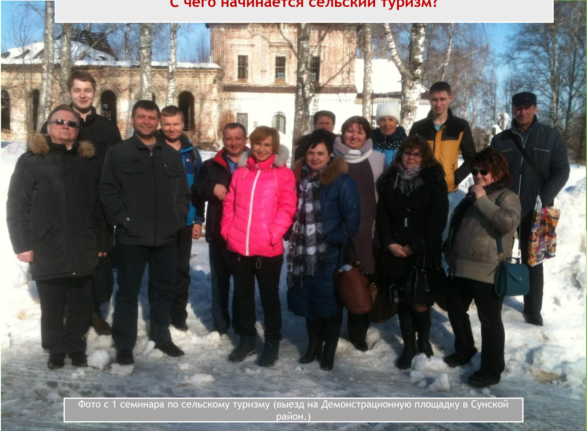
Фото с 1 семинара по сельскому туризму (выезд на Демонстрационную площадку в Сунской район.)