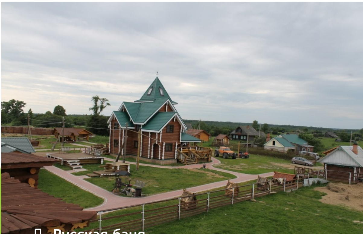
□ Русская баня