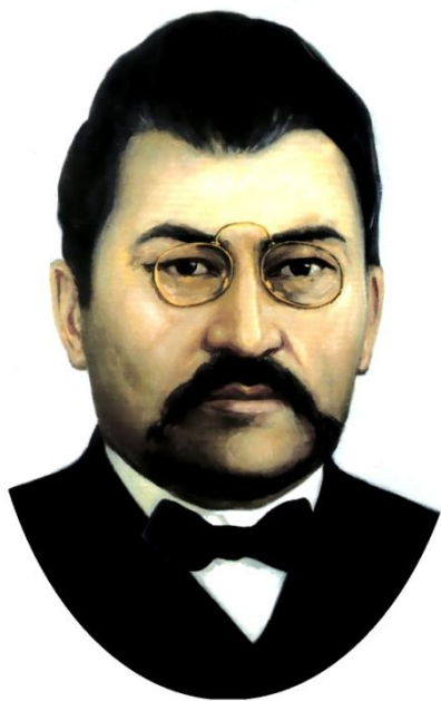
А. Байтұрсыно в