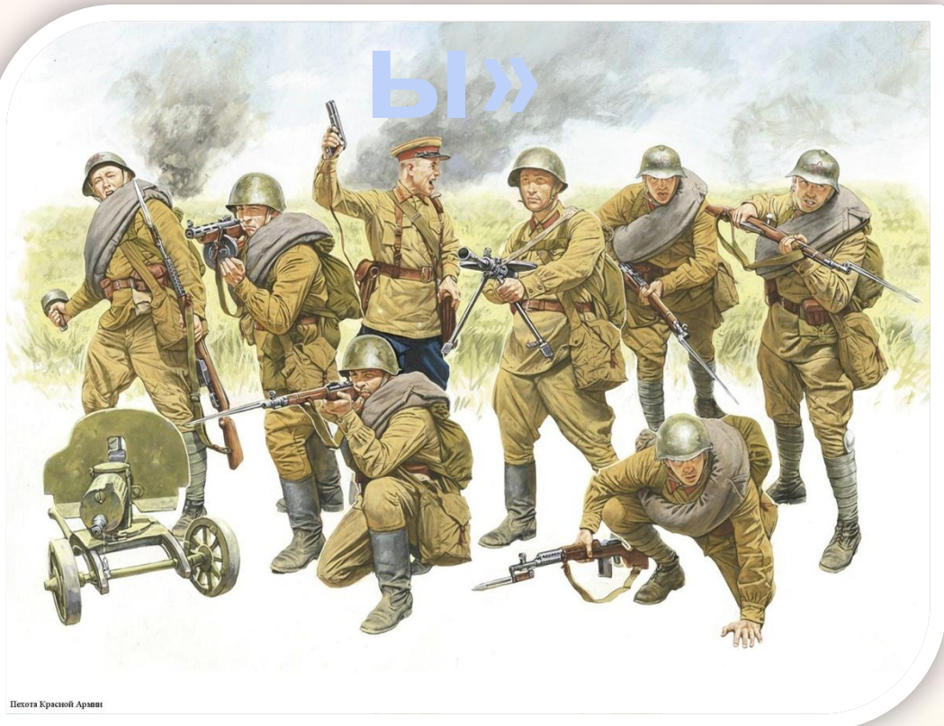
Иллюстрация Красной Армии