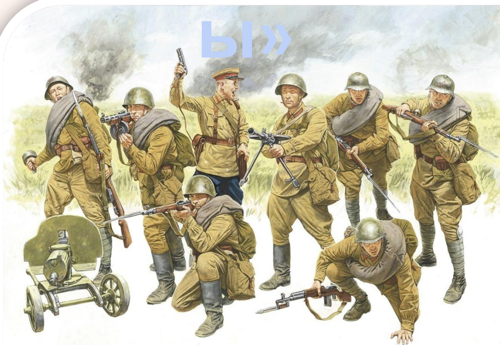
Иллюстрация Красной Армии