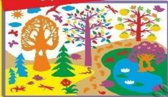
ФИОЛЕТОВЫЙ ЛЕС В ПОЛНОЙ КОМПЛЕКТАЦИИ