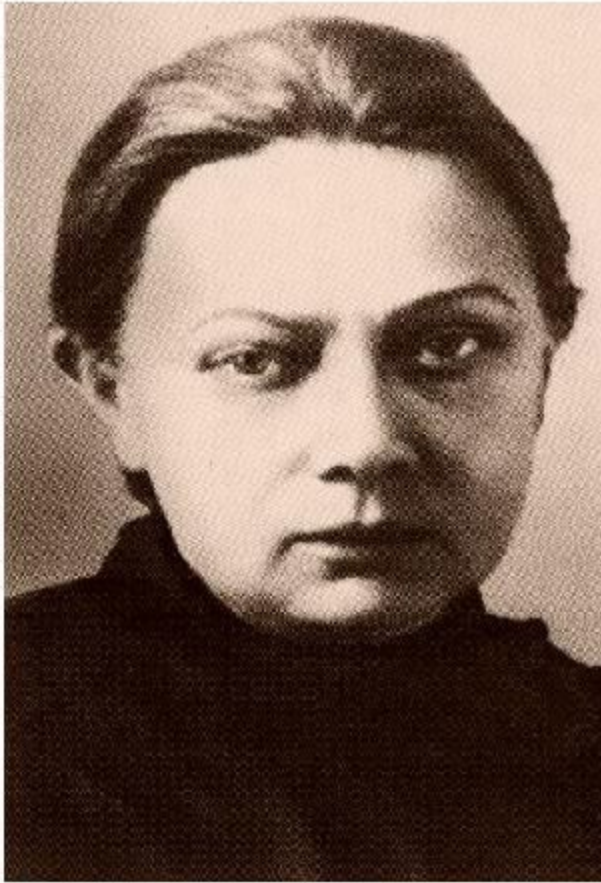
Крупская Надежда Константиновна