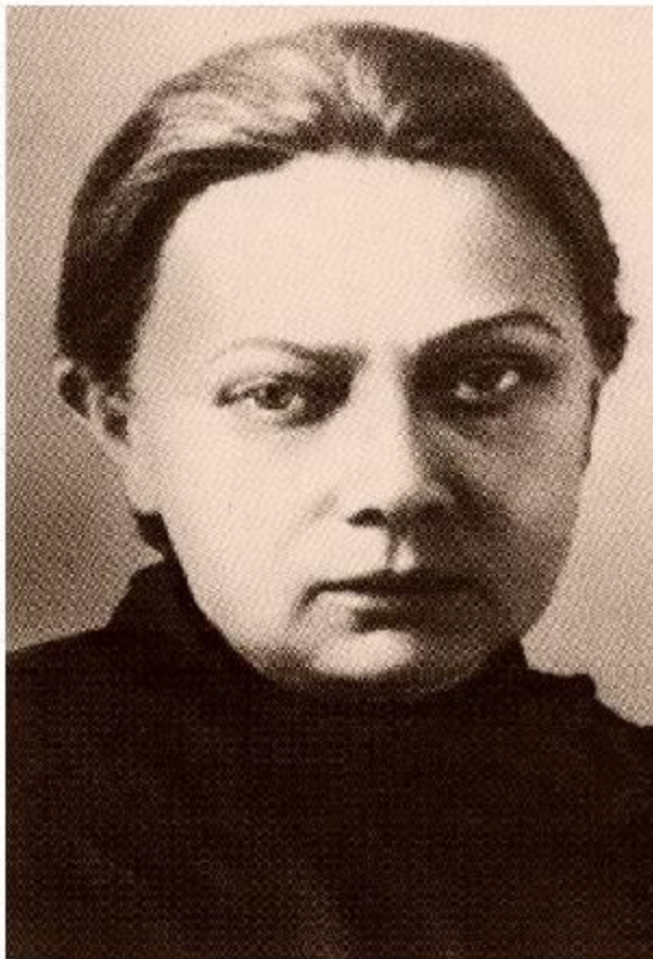
Крупская Надежда Константиновна