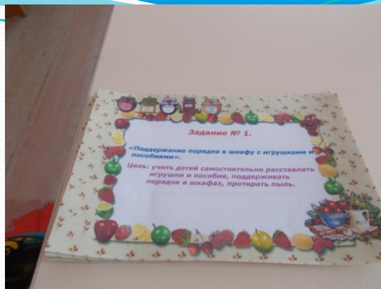
Картотека заданий для дежурных