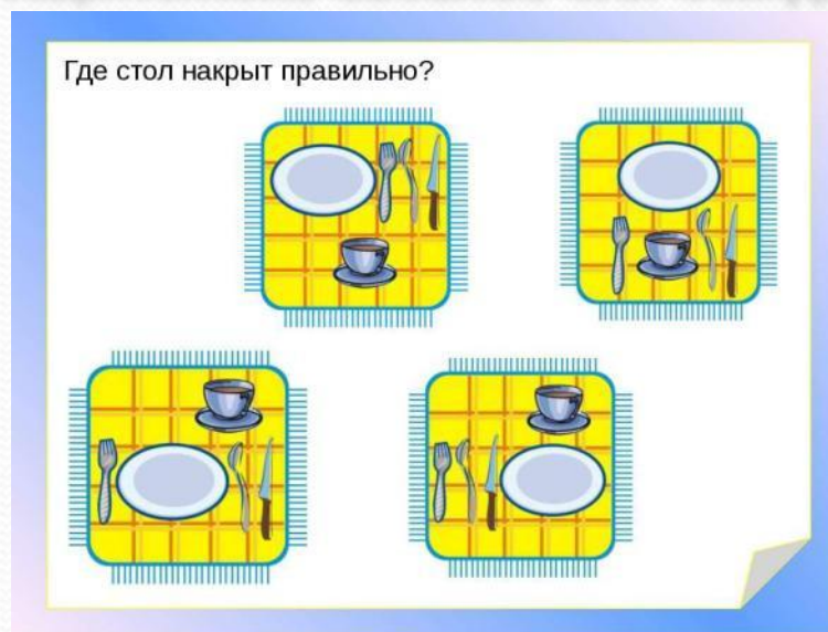
Игра "Накрой правильно стол"