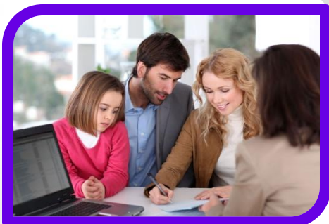
собрание всей семьи