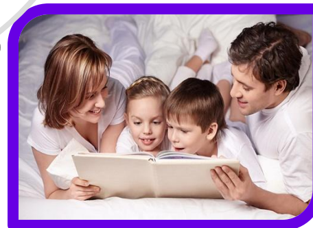
сказки перед сном