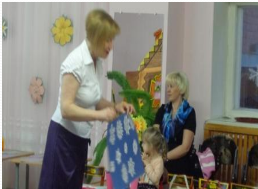
Рассматривание образцов снежинок.