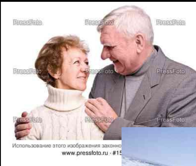
Использование этого изображения законно www.pressfoto.ru · #15