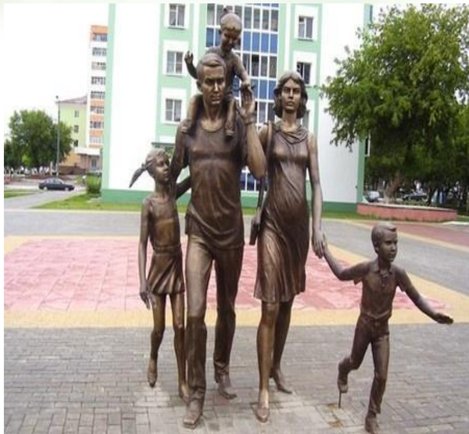
Памятник семье в Саранске