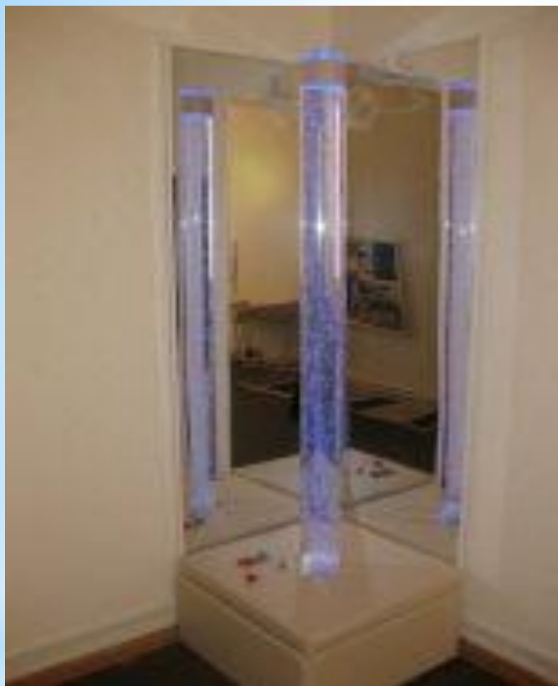
Интербелсенді құрғақ бассейнге арналған акрильді айна