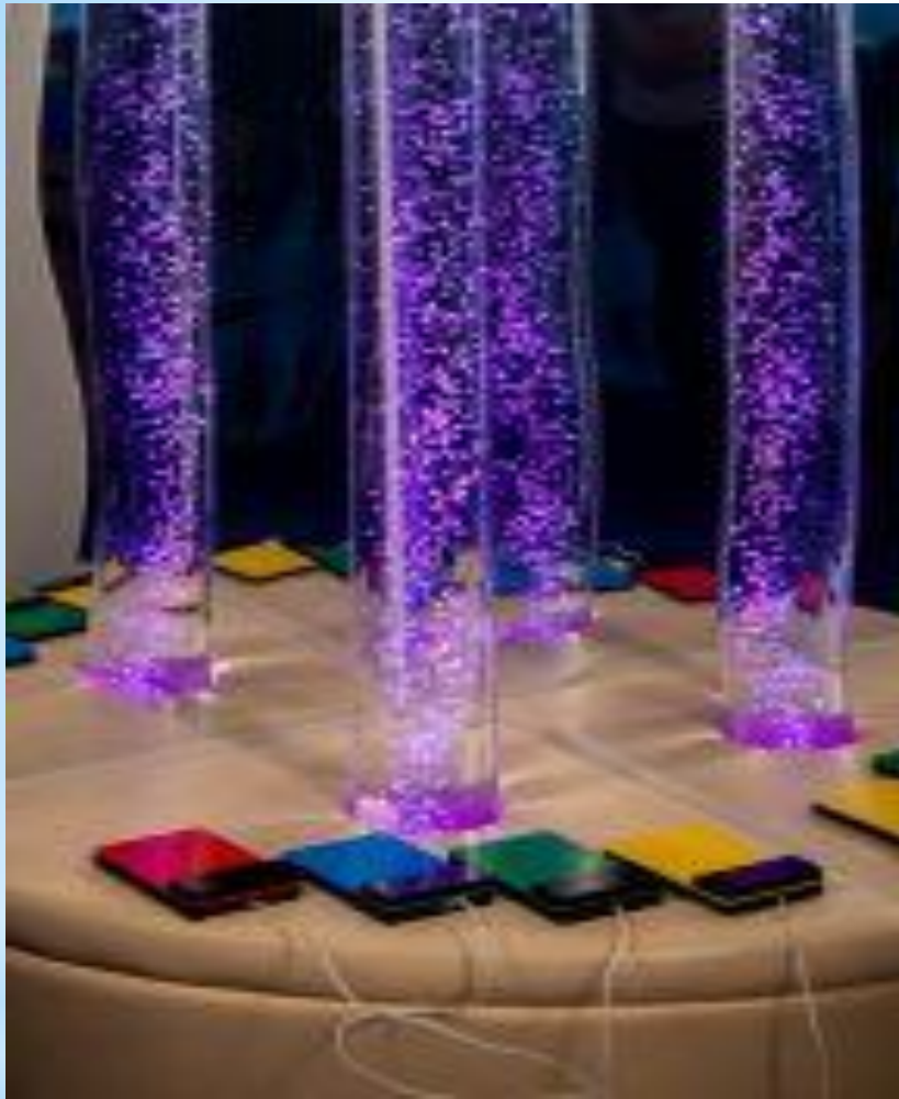
Ауалы-көпіршікті интербелсенді басқару пульті бар түтікше “Вдохновение”