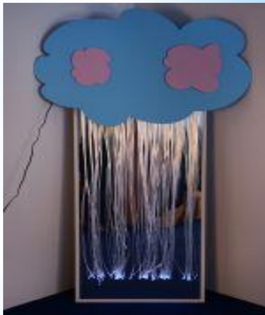
Фиброоптикалық жіптері бар айналы панно. “Разноцветный дождь”