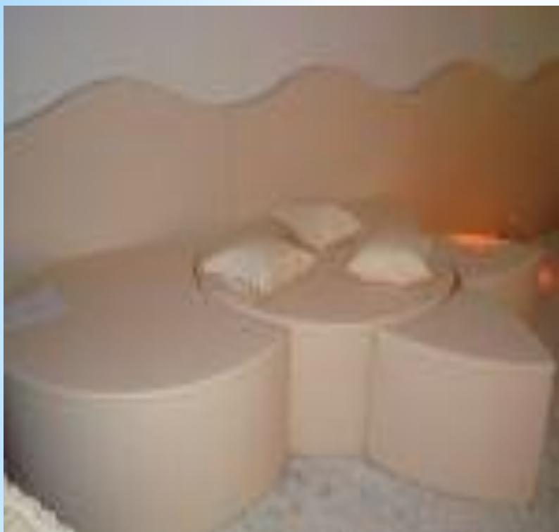
Жұмсақ комплекс “Ромашка”