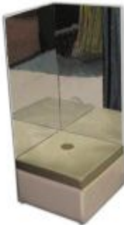
Айнасы бар жұмсақ ойын тумбасы