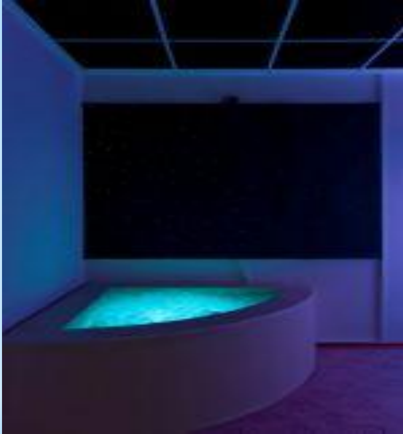
Фиброоптикалық кілем “Млечный путь”