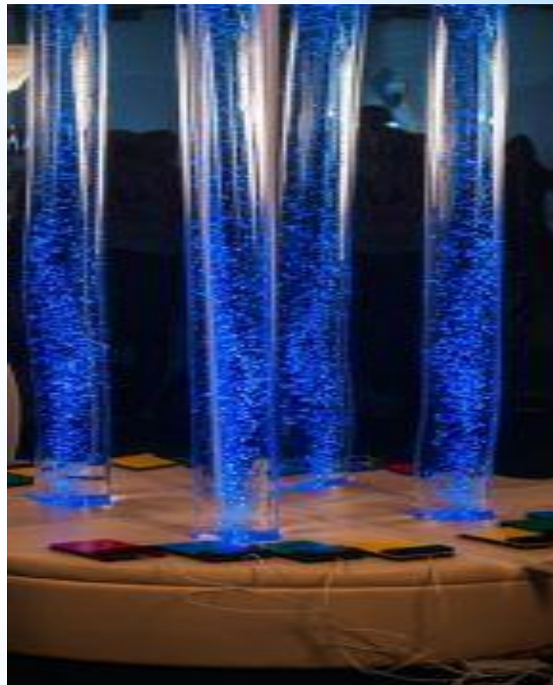
Ауалы-көпіршікті интербелсенді басқару пульті бар түтікше «Радуга»