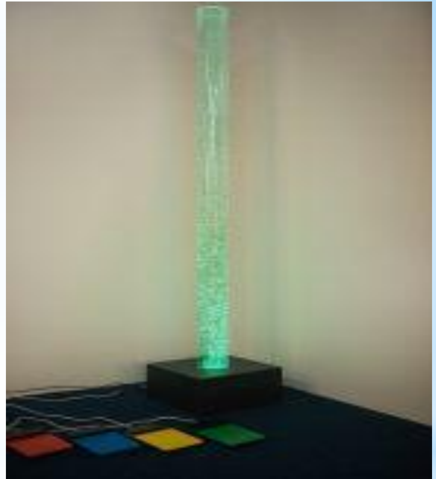
Ауалы-көпіршікті интербелсенді басқару пульті бар түтікше “Настроение”