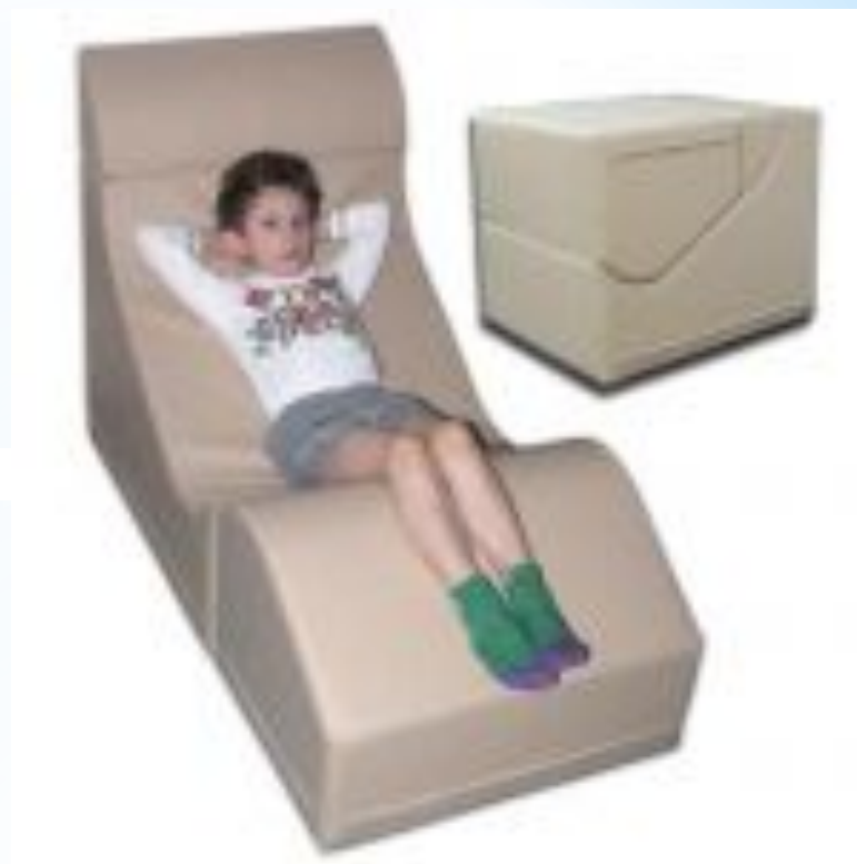
Балалар кұрастырмалы креслосы «Трансформер»