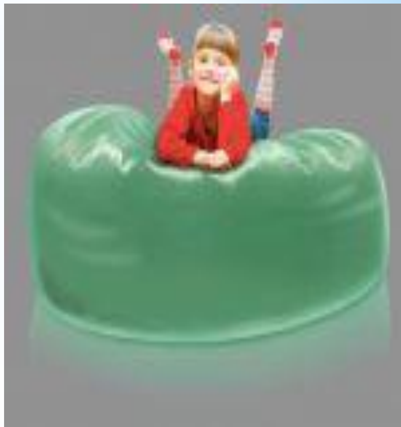
Жұмсақ форма “Остров”