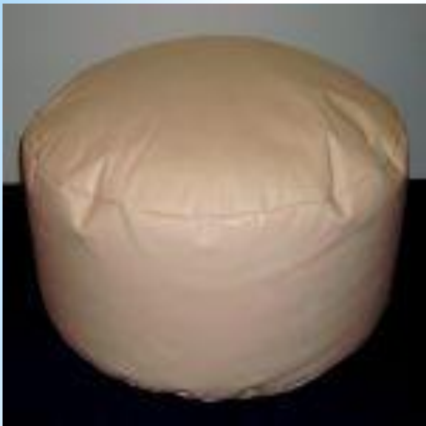
Жұмсақ форма “Домалақ пуфик”