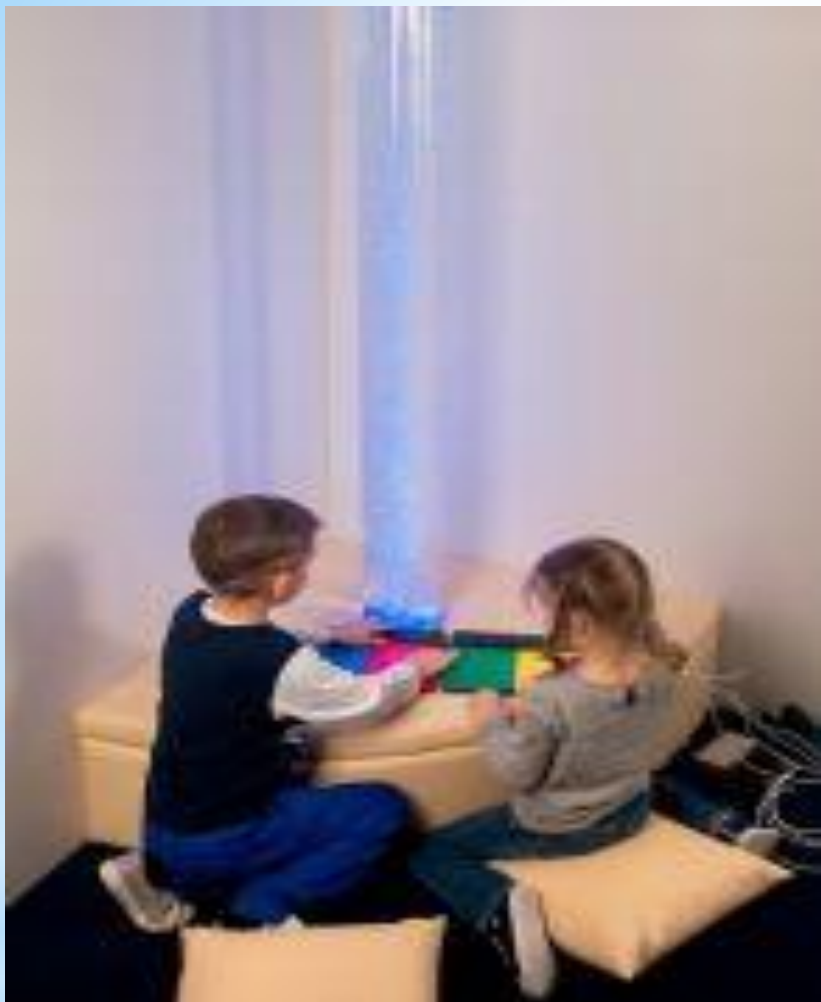
Ауалы-көпіршікті интербелсенді басқару пульті бар түтікше «Ручейка»