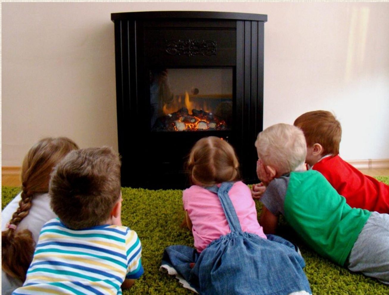
Камин – имитация пламени