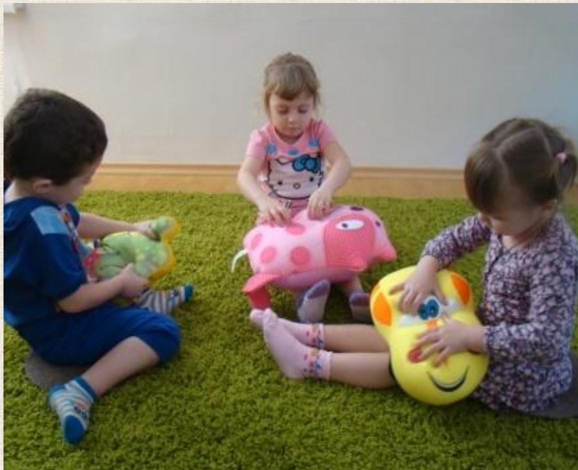
Детские подушечки с гранулами