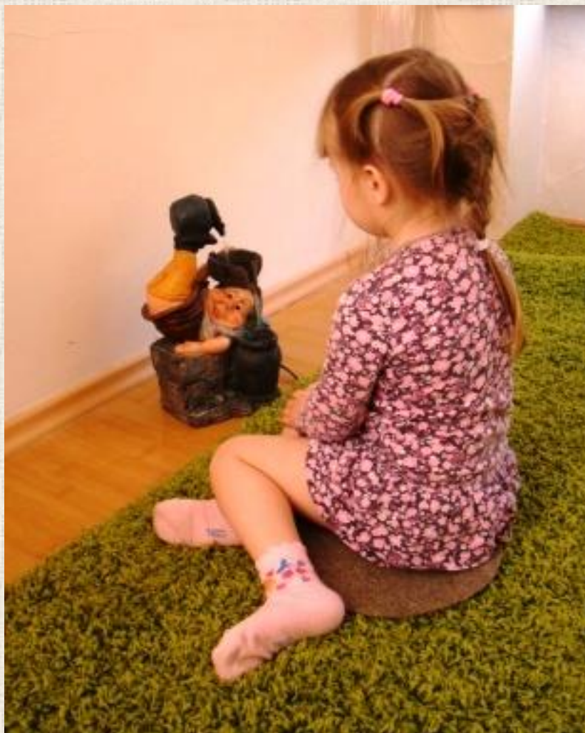
Настольный фонтан «Гном с кувшином»