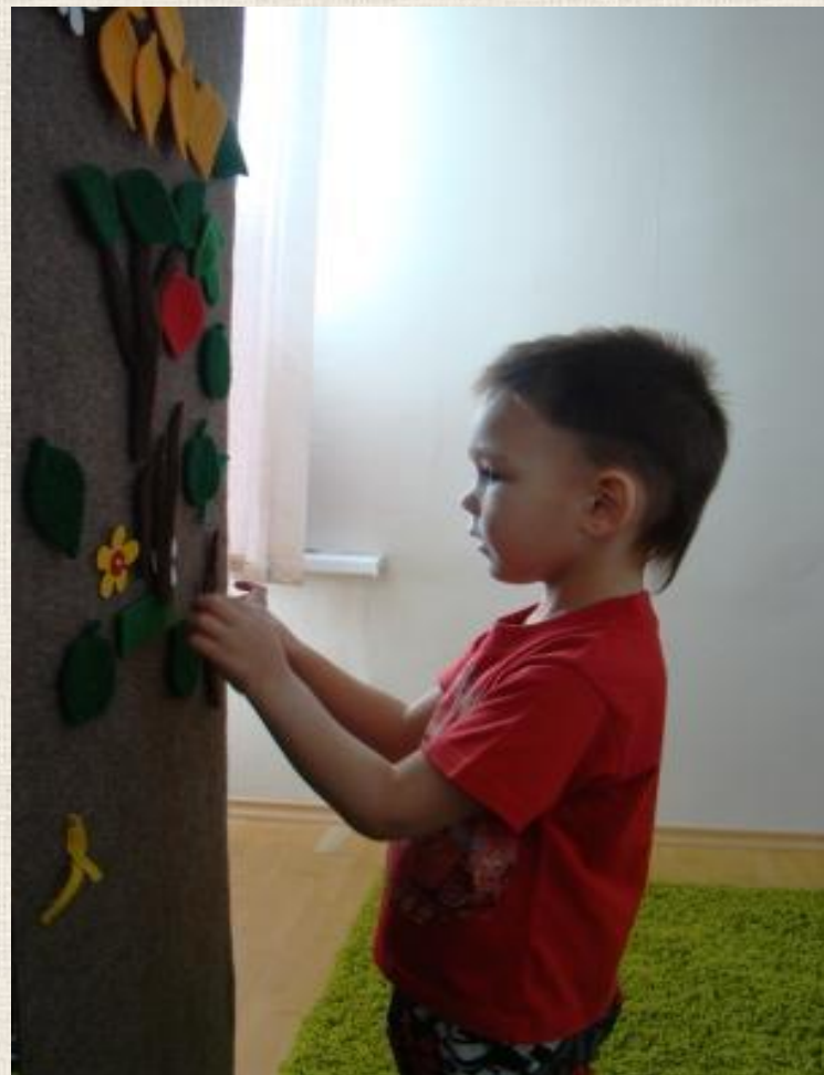
Тактильное панно «Дерево»