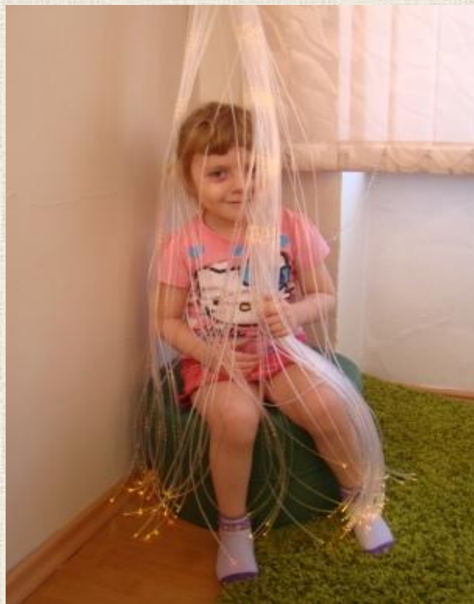
Пучок из светоптических волокон «Звездный дождь»