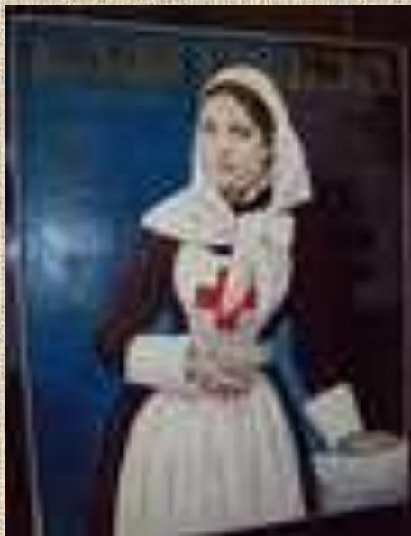
Баронесса Юлия Петровна Вревская (1841-1878)