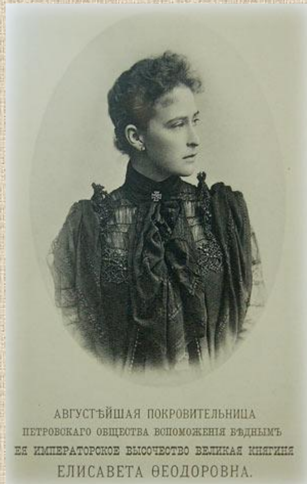
АВГУСТЪЙШАЯ ПОКРОВИТЕЛЬНИЦА ПЕТРОВСКАГО ОБЩЕСТВА ВОСПОМОЖЕНІЯ ВЪДНѢМЪ ЕЯ ИМПЕРАТОРСКОЕ ВЫСОЧЕСТВО ВЕЛИКАЯ КНЯГИНЯ ЕЛИСАВЕТА ФЕОДОРОВНА.