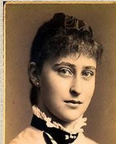
Великая княгиня Елизавета Федоровна Романова (1864-1918)