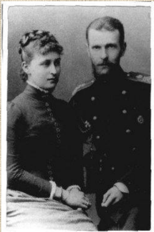
Великая княгиня Елизавета Федоровна и великий князь Сергей Александрович.