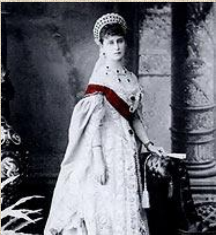
Великая княгиня Елизавета Фёдоровна

« Я испытывала такую глубокою жалостью к России и её детям , которые в настоящее время не знают , что творят. Разве это не больной ребёнок , которого мы любим во сто раз больше во время его болезни , чем когда он весел и здоров? Хотелось бы понести его страдания , помочь ему . Святая Россия не может погибнуть . Но великой России , увы, больше нет . Мы ... должны устремить свои мысли к Небесному Царствию ... и сказать с покорностью : «Да будет воля Твоя». (Из письма Елизаветы Федоровны)