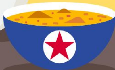
Суп из сома