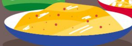
Капуста ким чи