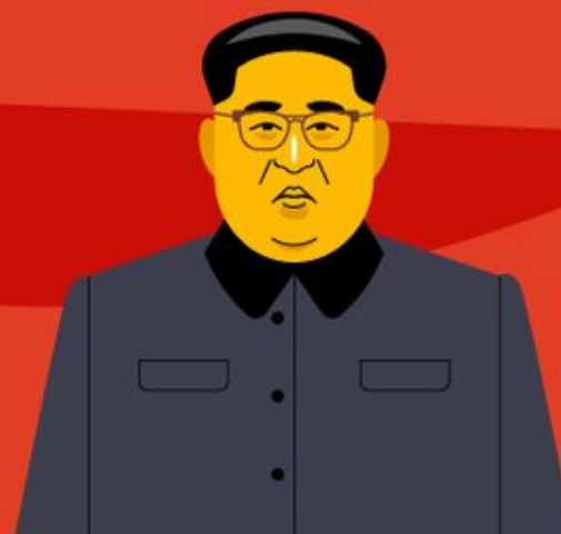
Ким Чен Ын высший руководитель КНДР