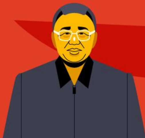
Ким Чен Ир вечный генеральный секретарь ТПК