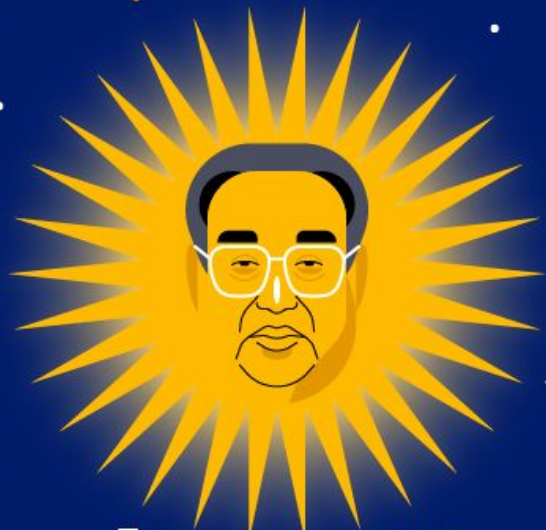
День рождения Ким Ир Сена "День Солнца" 15 апреля