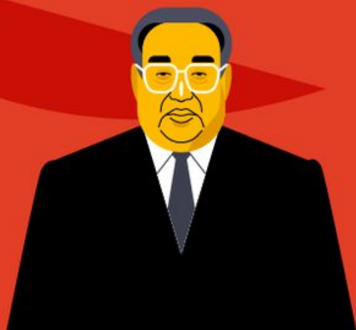
Ким Ир Сен вечный президент