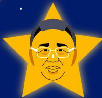
День рождения Ким Чен Ира "День Звезды" 16 февраля