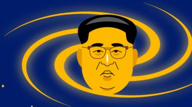
День рождения Ким Чен Ына "День Галактики" 8 января