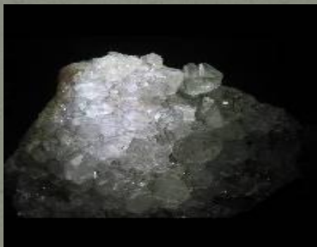
КАРНАЛЛИТ \text{KCl} \cdot \text{MgCl}_2 \cdot 6\text{H}_2\text{O}