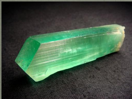
СПОДУМЕН \text{Li}_2\text{O} \cdot \text{Al}_2\text{O}_3 \cdot 4\text{SiO}_2