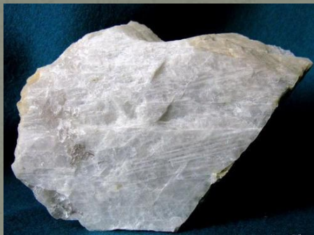
ПОЛЕВОЙ ШПАТ \text{K}_2\text{O} \cdot \text{Al}_2\text{O}_3 \cdot 6\text{SiO}_2