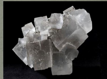
КАМЕННАЯ СОЛЬ \text{NaCl}