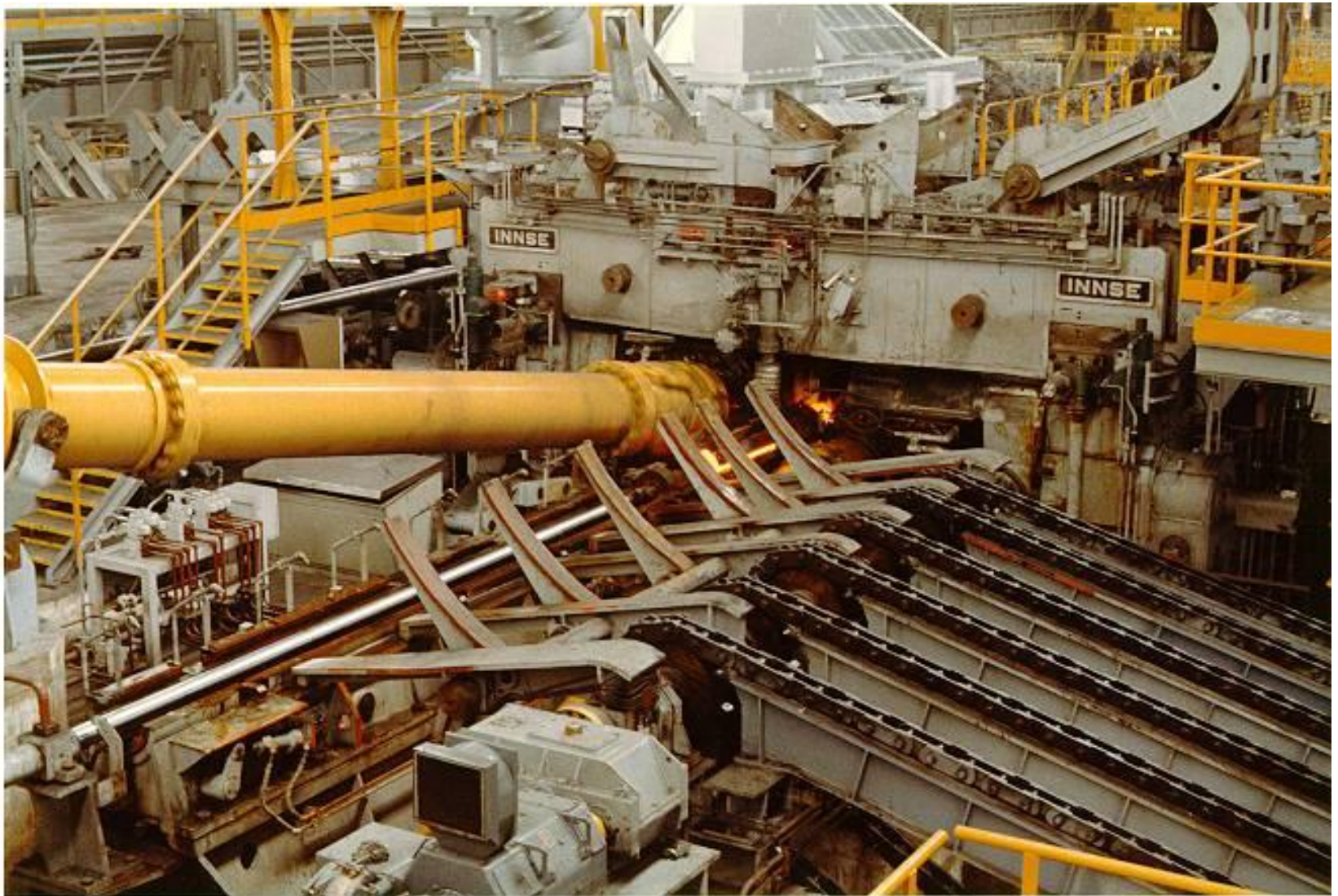
Прошивной стан, вид с входной стороны