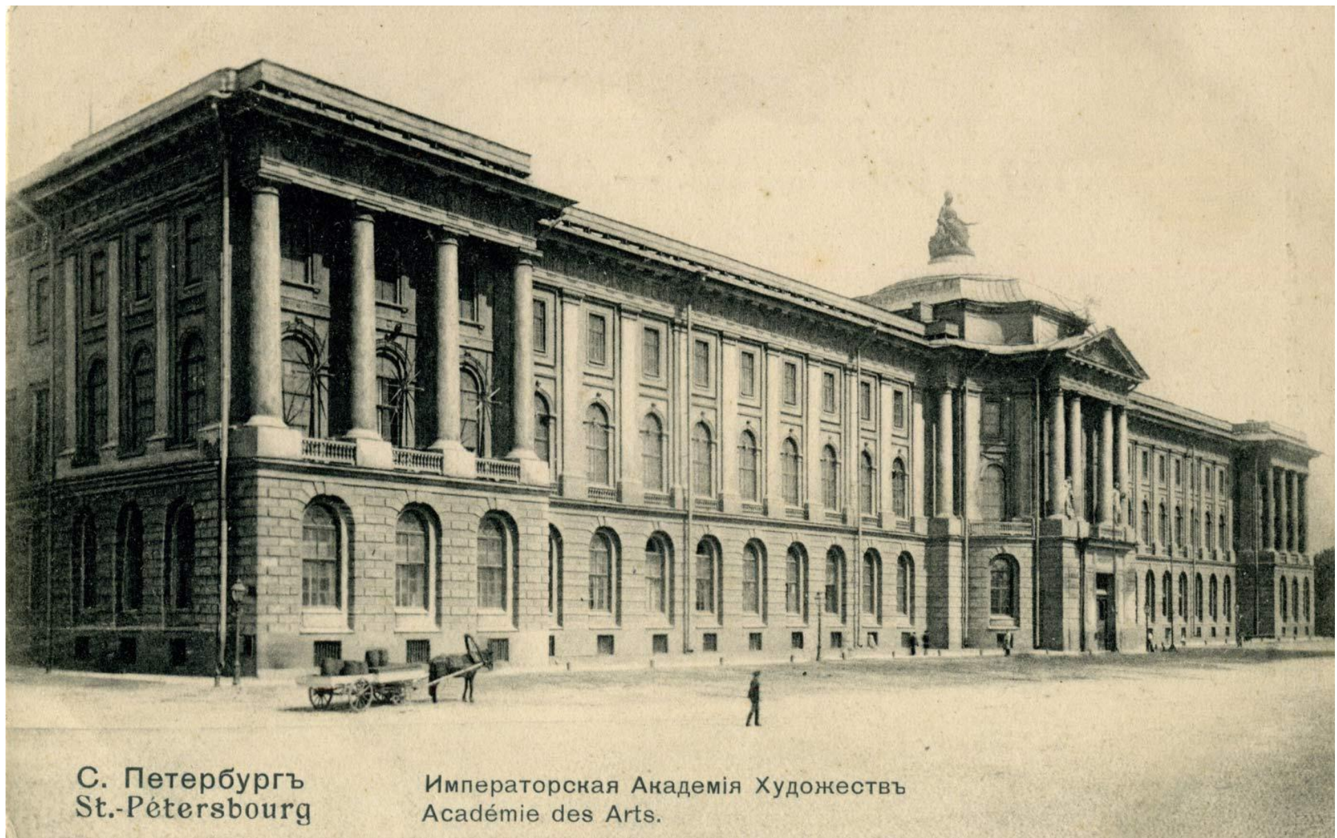
С. Петербургъ St.-Petersbourg