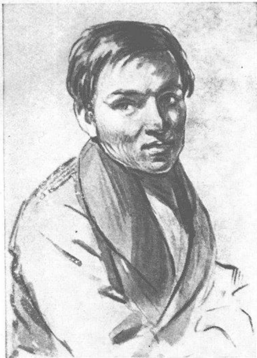
І. М. Сошенко. Рис. П. Ю. Заболотського. 1834 р.

Фрагмент рисунку з портретом І.М.Сошенка