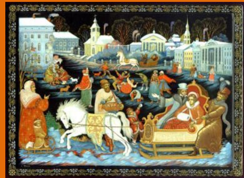
Палеховские художники «Масленица»