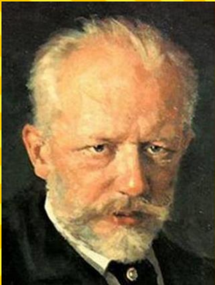
П.И.Чайковский «Времена года. Февраль. Масленица»