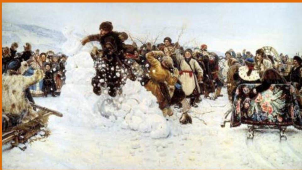
В.Суриков «Взятие снежного городка»