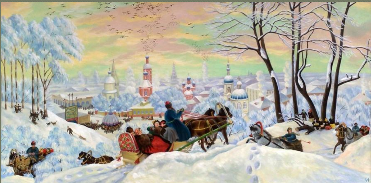
Б. М. Кустодиев «Блинный вторник»