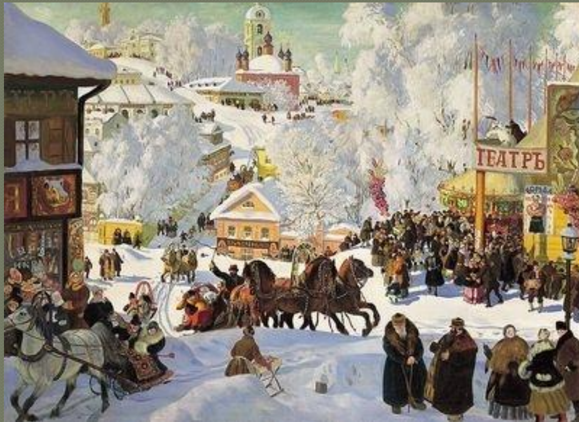
Б. М. Кустодиев “Масленица”