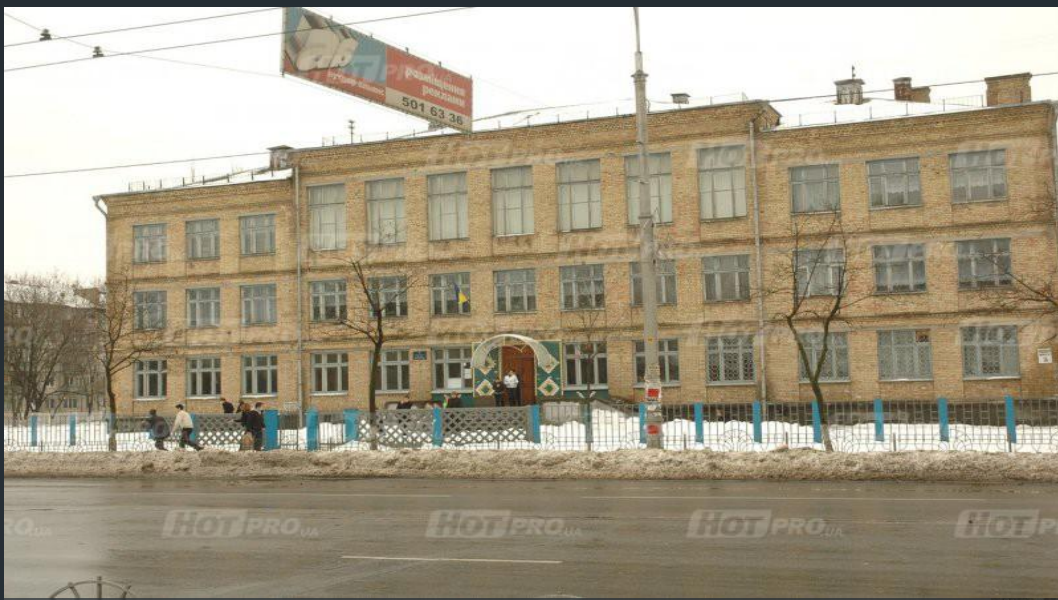
ФОТО ШКОЛИ №146