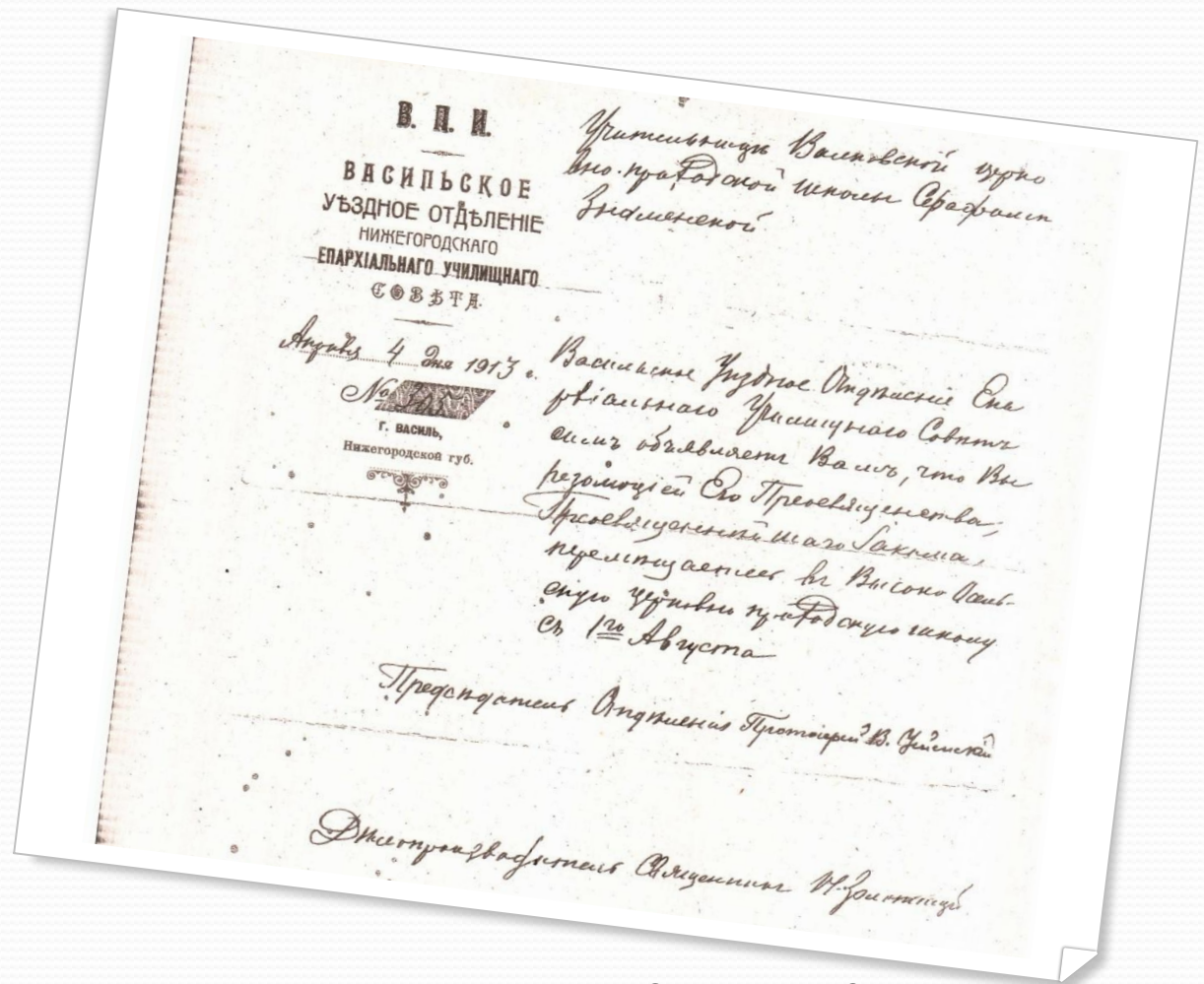
Документ о переводе учительницы Серафимы Знаменской в Высокоосельскую церковно-приходскую школу. 4 апреля 1913 г

20 марта (2 апреля по новому стилю) 1869 года можно считать днем рождения Высокоосельск ой школы