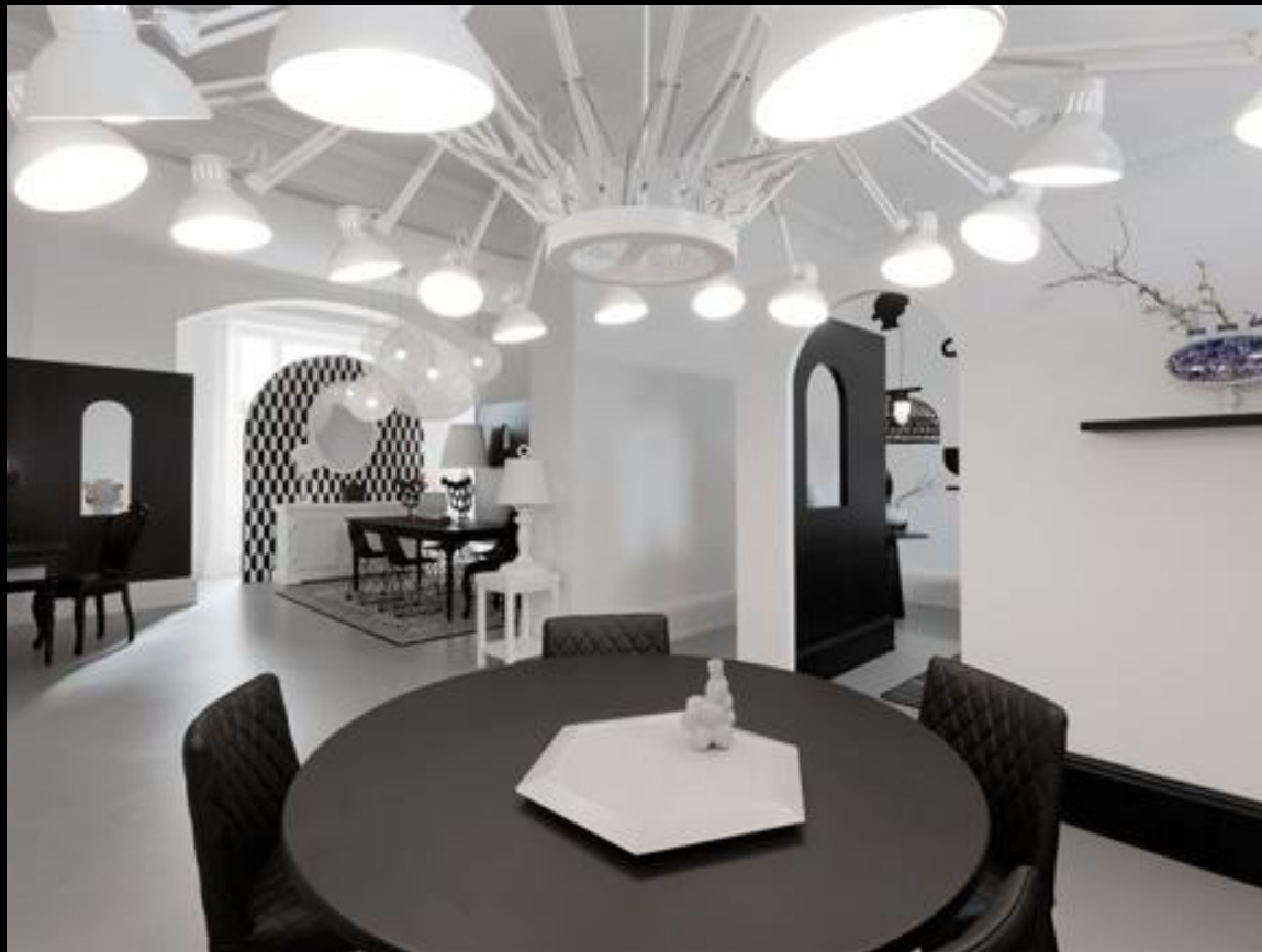
Шоу-рум Мооі в Лондоне