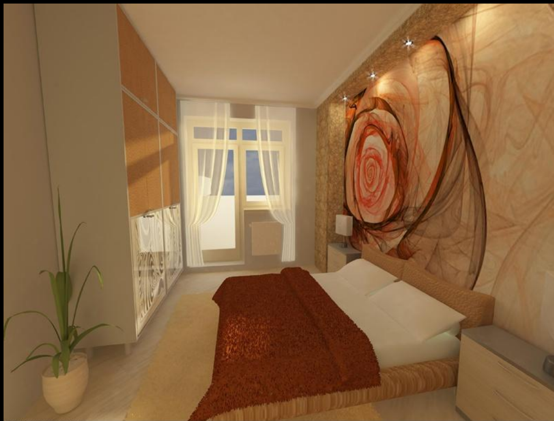
Шоу-рум. Строительная компания "Эфес".

Независимо от направленности шоу-рума, её суть неизменна – это выставка образцов товара либо услуг. Кроме того, шоу-рум может быть при фирме-изготовителе, франчайзинговым, дистрибьюторским. Последний вариант, кстати, наиболее распространён.