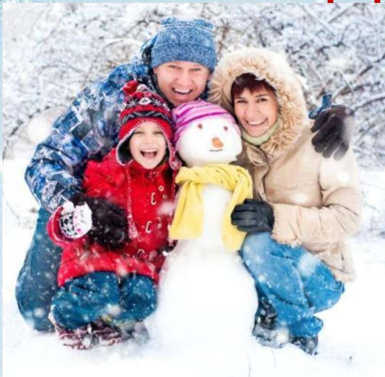
Фото-сессия на природе

Возьмите с собой на прогулку фотоаппарат и устройте зимнюю семейную фото-сессию. В перерыве между съемкой можно организовать пикник: подготовьте чай в термосе, возьмите с собой бутерброды, сладости. У детей останутся незабываемые впечатления!