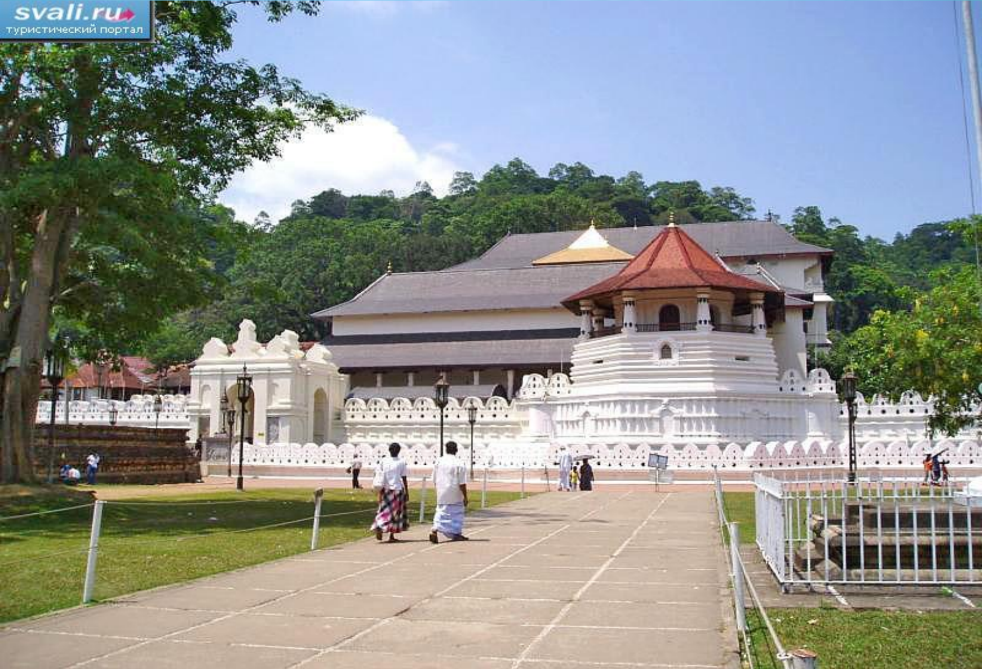
ХРАМ ЗУБА БУДДИ