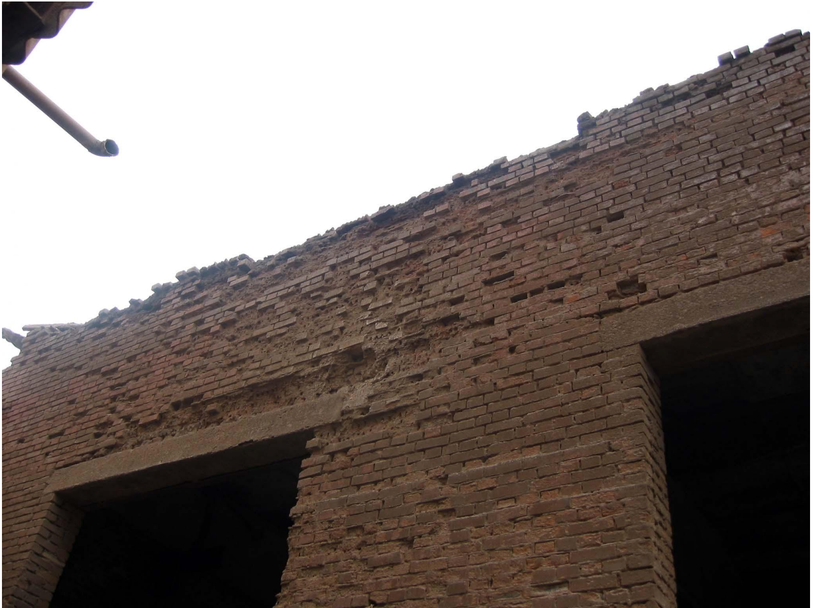
Сильная эрозия кладки карниза и стены. Выпадение кирпичей из кладки карниза. Отсутствие карниза