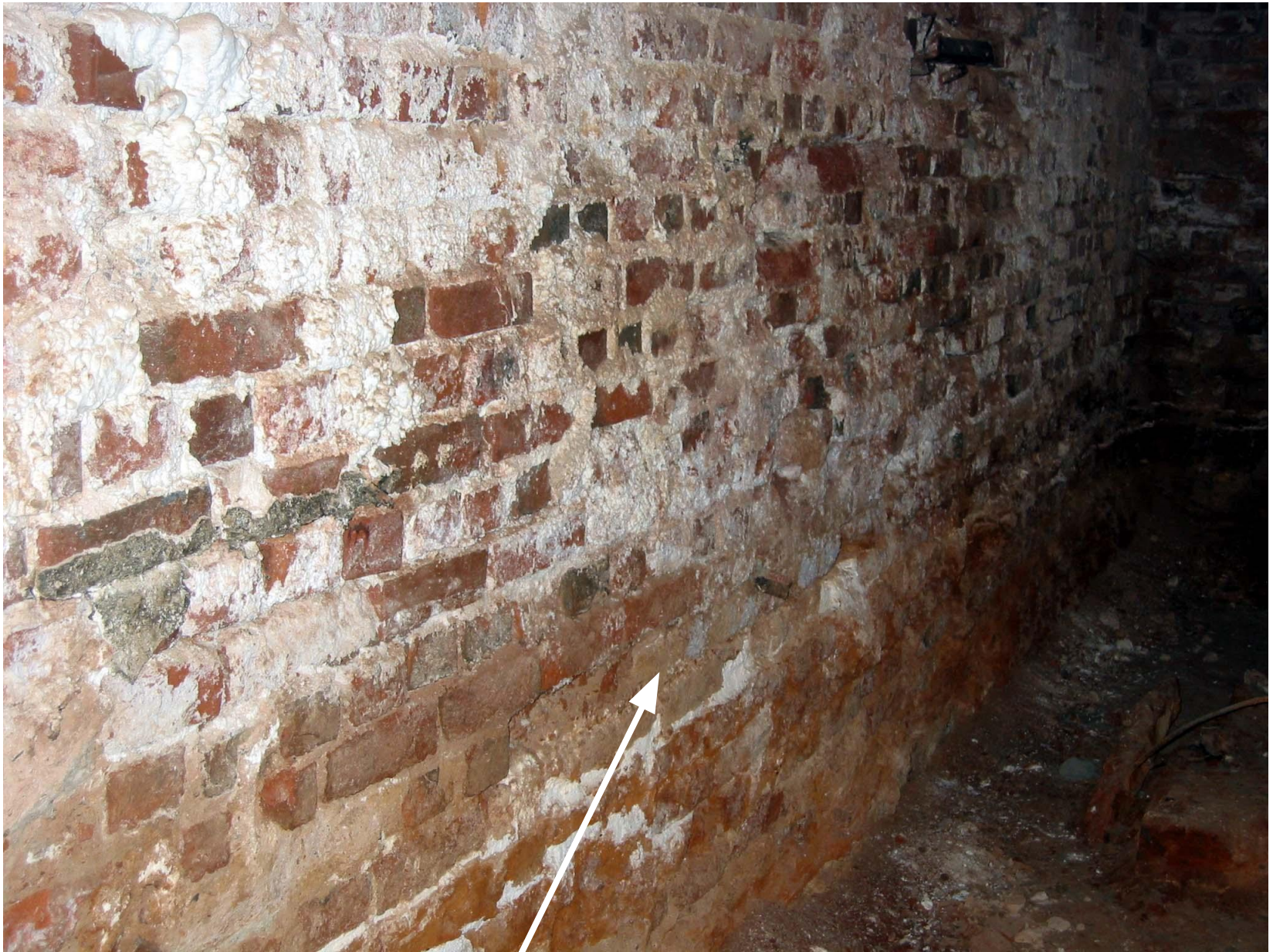
Сильная эрозия кладки стен. Высолы. Отложения солей на кладке